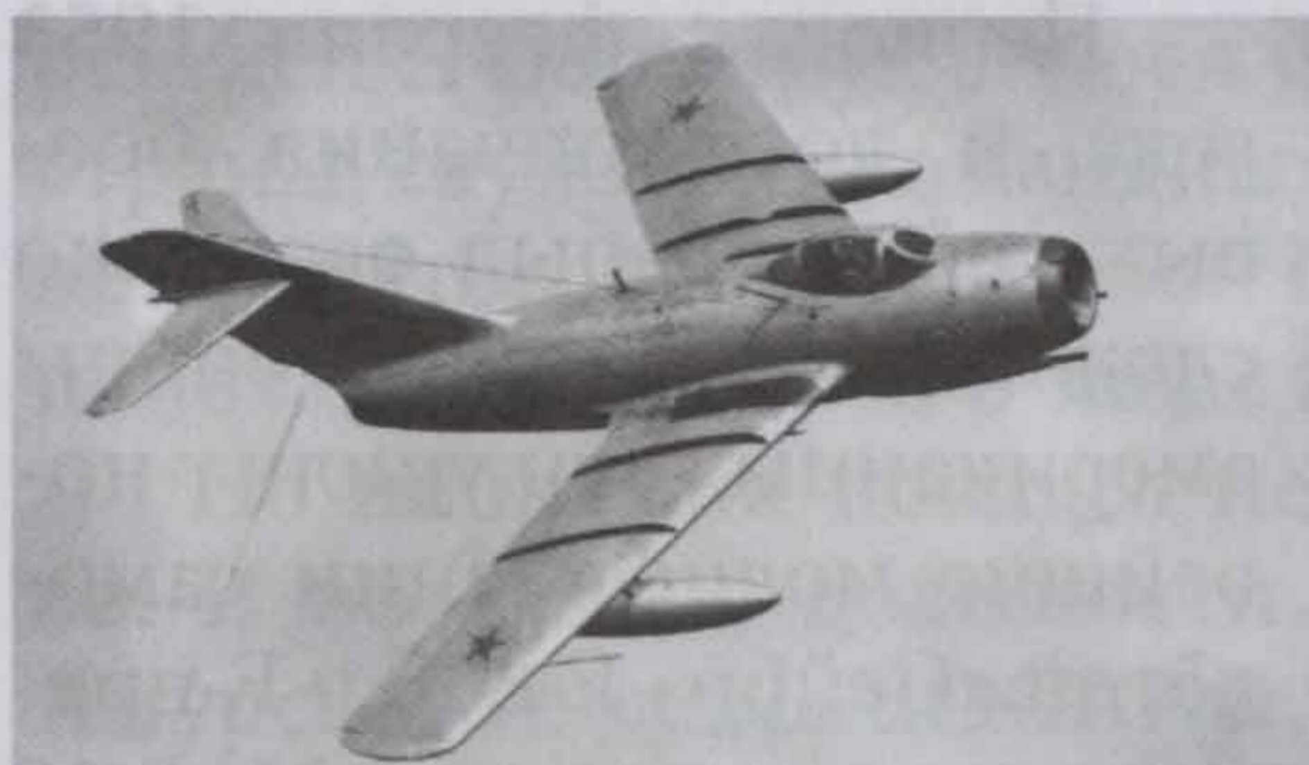
Реактивный истребитель МИГ-15 бис

аэроклубе. Потом — Серпуховская военная авиационная школа летчиков, которую окончил в 1940 году. Был направлен на Дальний Восток в морскую авиацию. Начал службу в сентябре 1940 года младшим лётчиком в 45-м истребительном авиационном полку, в то время воору-