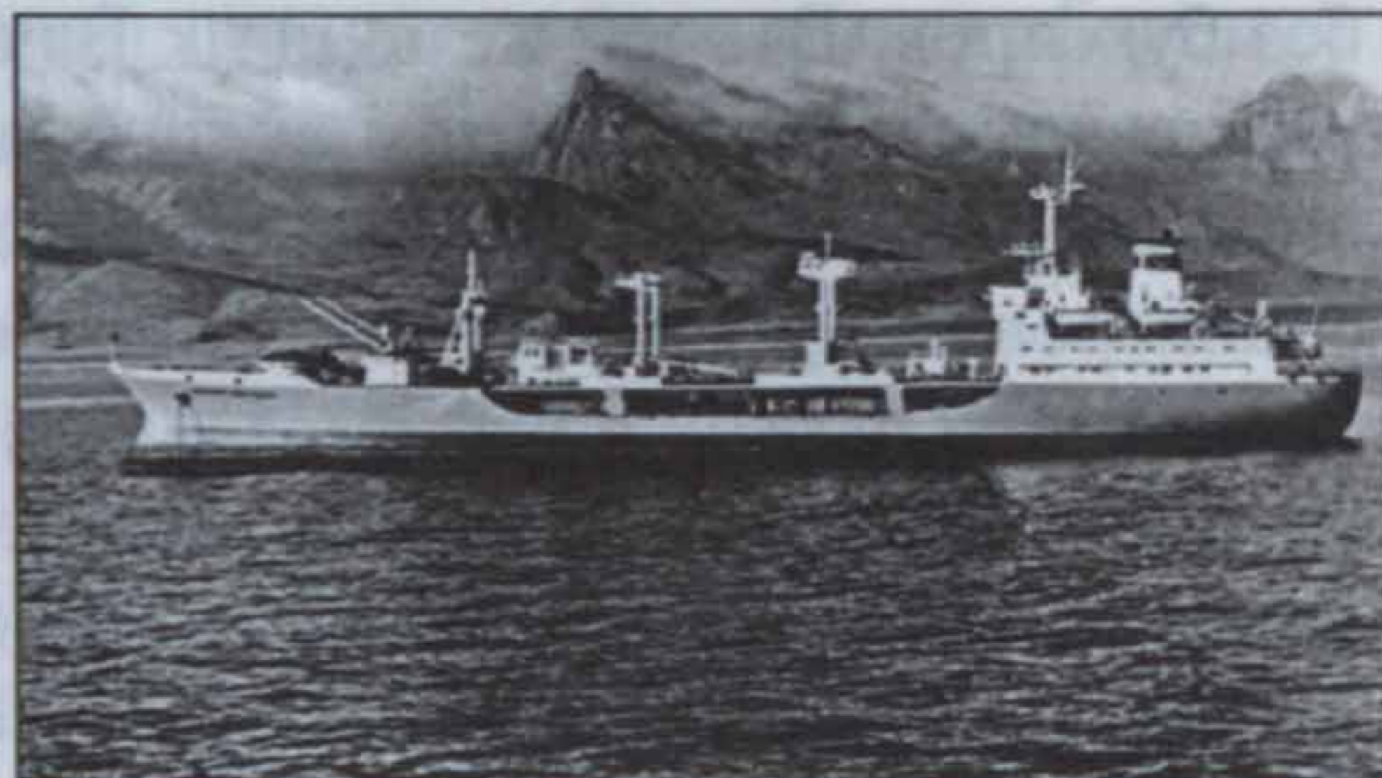
Танкер «Владимир Колечицкий». Суэцкий залив, 1984 год