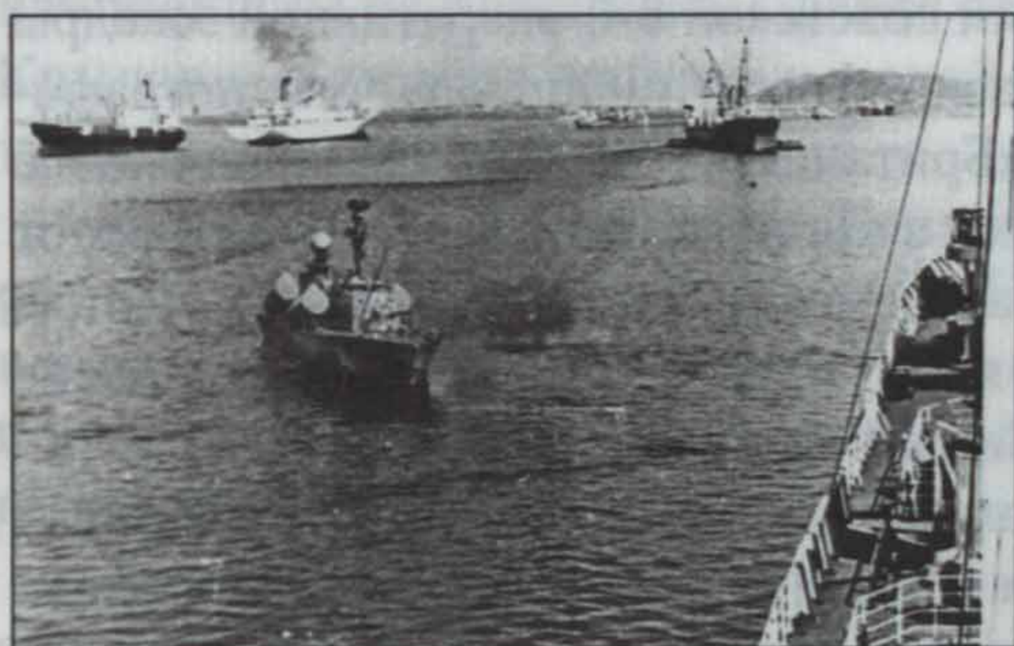
Аден, январь 1986 года. Ракетный катер йеменских ВМС под прикрытием борта танкера «Владимир Колечицкий» (справа) ведёт огонь по президентскому дворцу