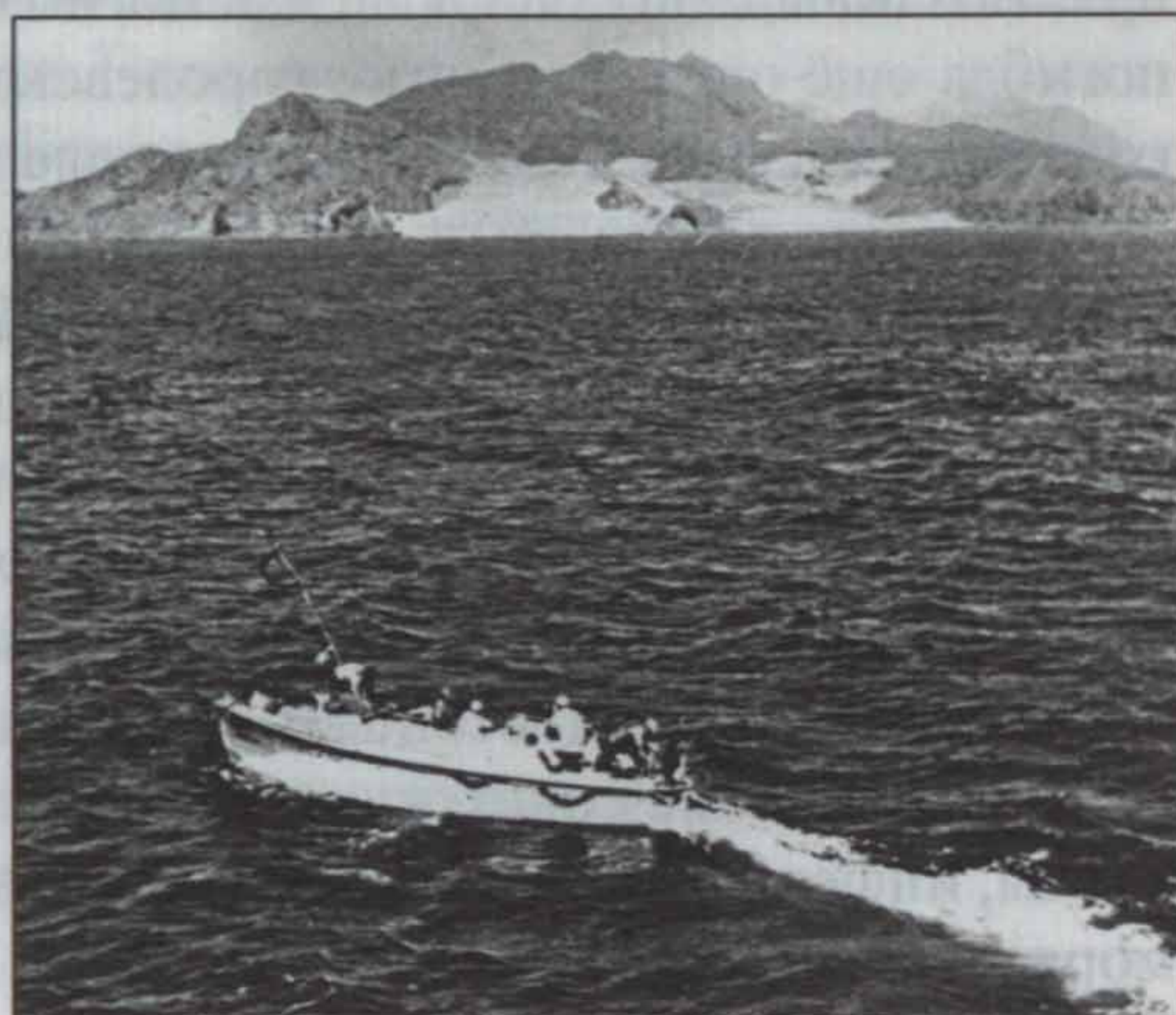
Рабочий катер танкера «Владимир Колечицкий» перевозит эвакуированных из Адена