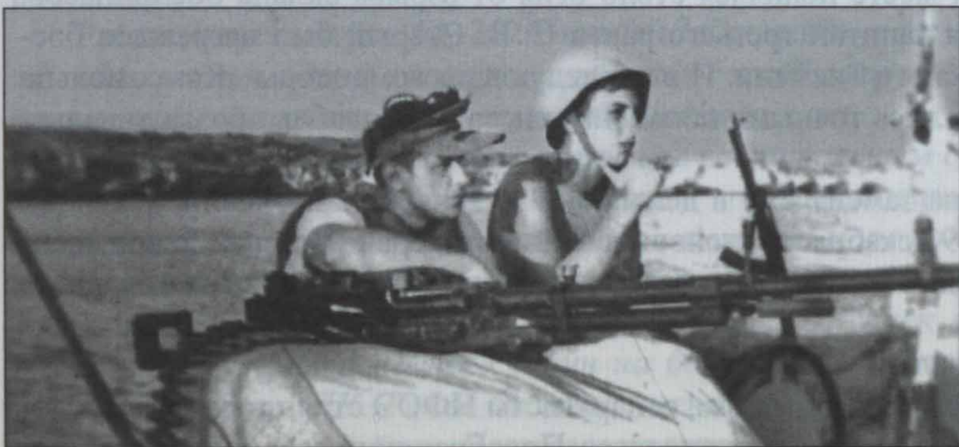
Пулемётчики артиллерийского катера АК-312