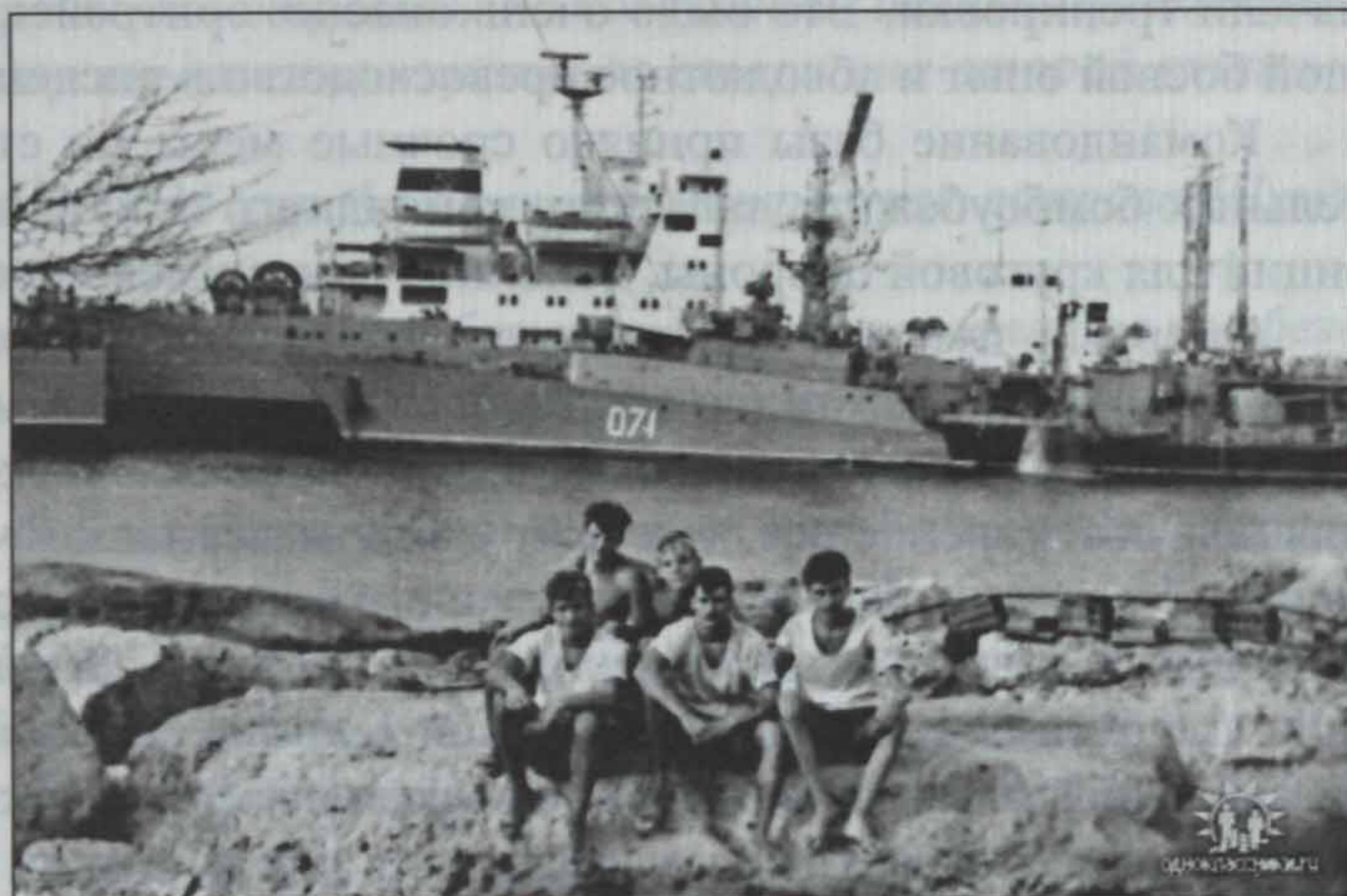
Матросы малого противолодочного корабля «Комсомолец Молдавии». Остров Нокра, 1990 год