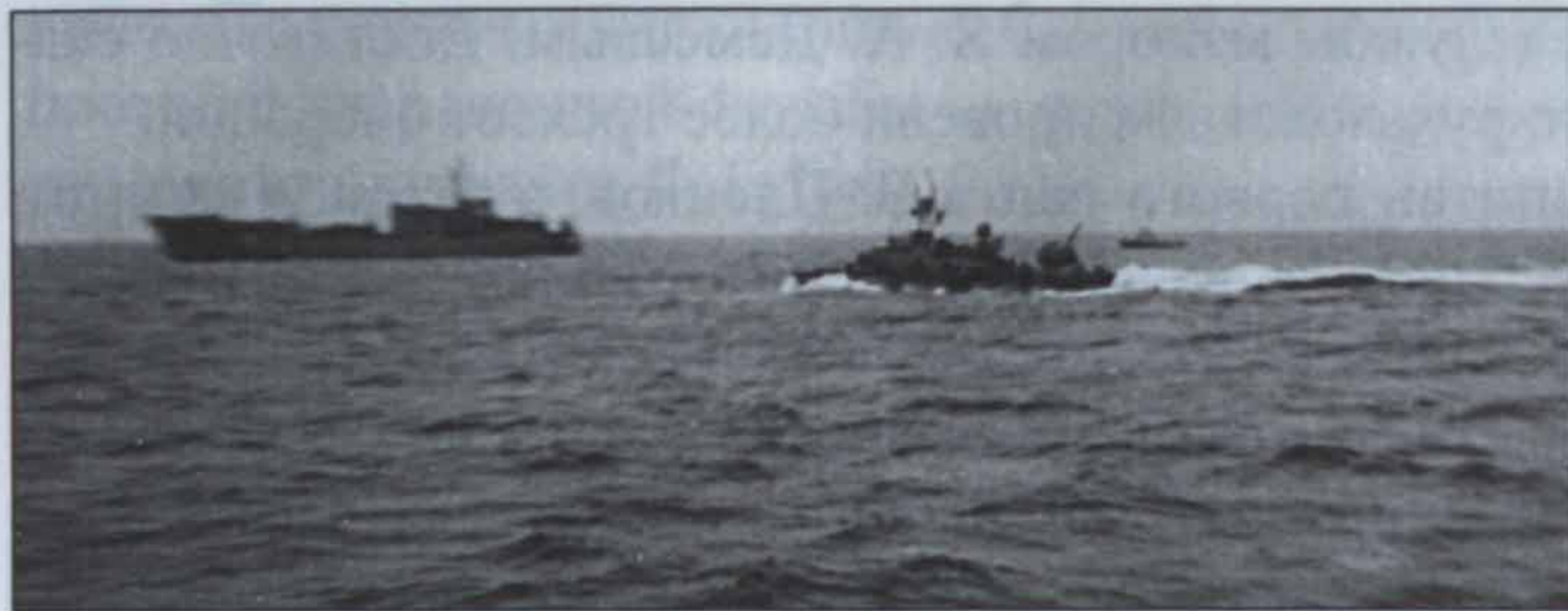
Советские корабли ПМ-129 и буксир РБ-105 в охране торпедного катера ТК-72 покидают базу на острове Нокра. Февраль 1991 года