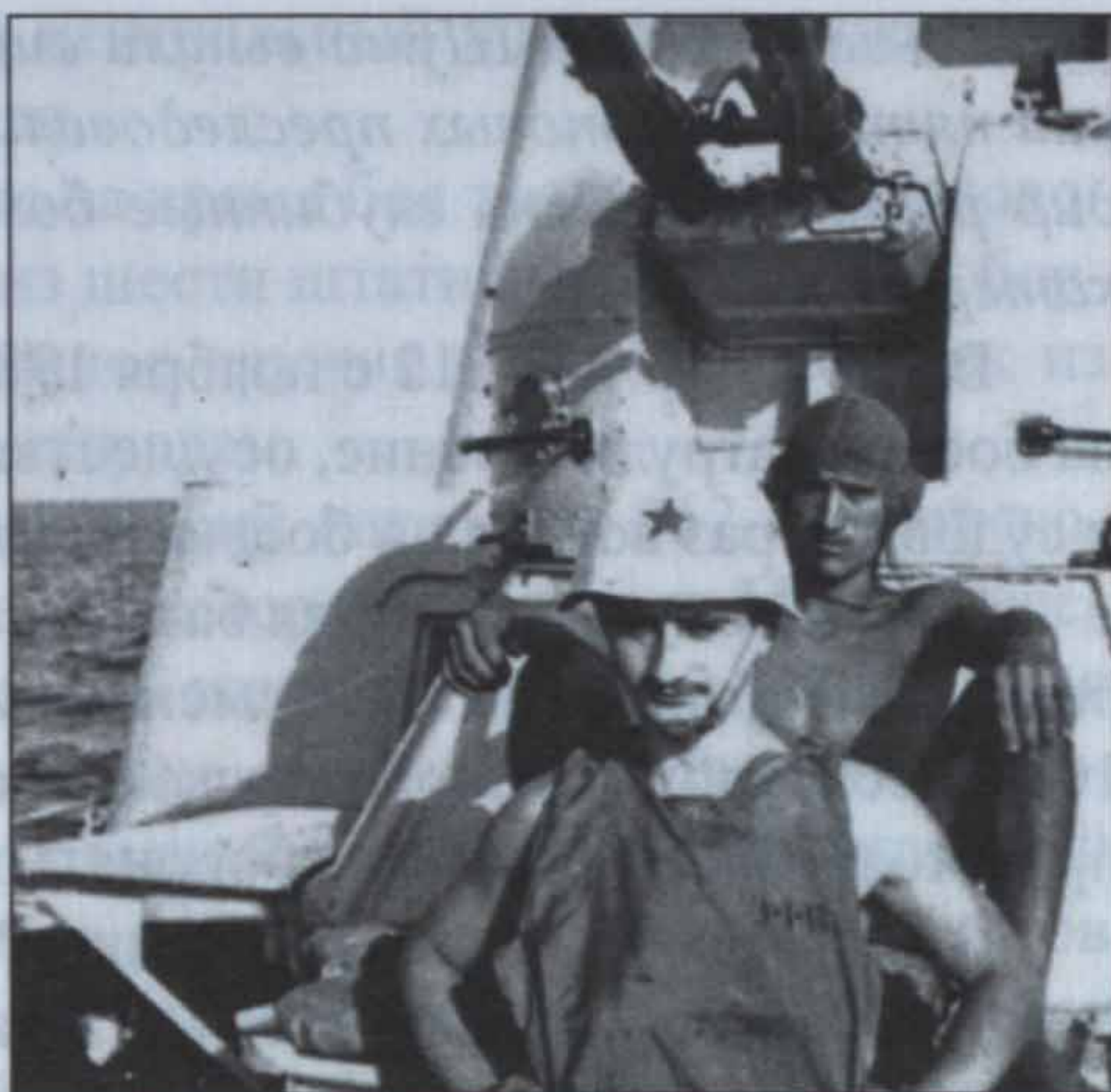
Комендоры кормового орудия артиллерийского катера АК-312