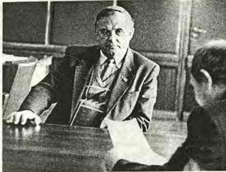
Рабочий день губернатора. 1992 г.