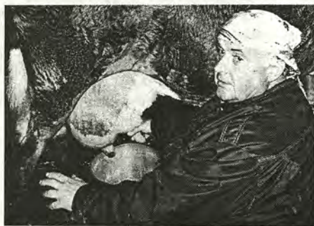
Корову доить – это вам не книги писать...