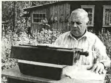
Вся 600-страничная «Схватка» была отстукана на этой машинке.