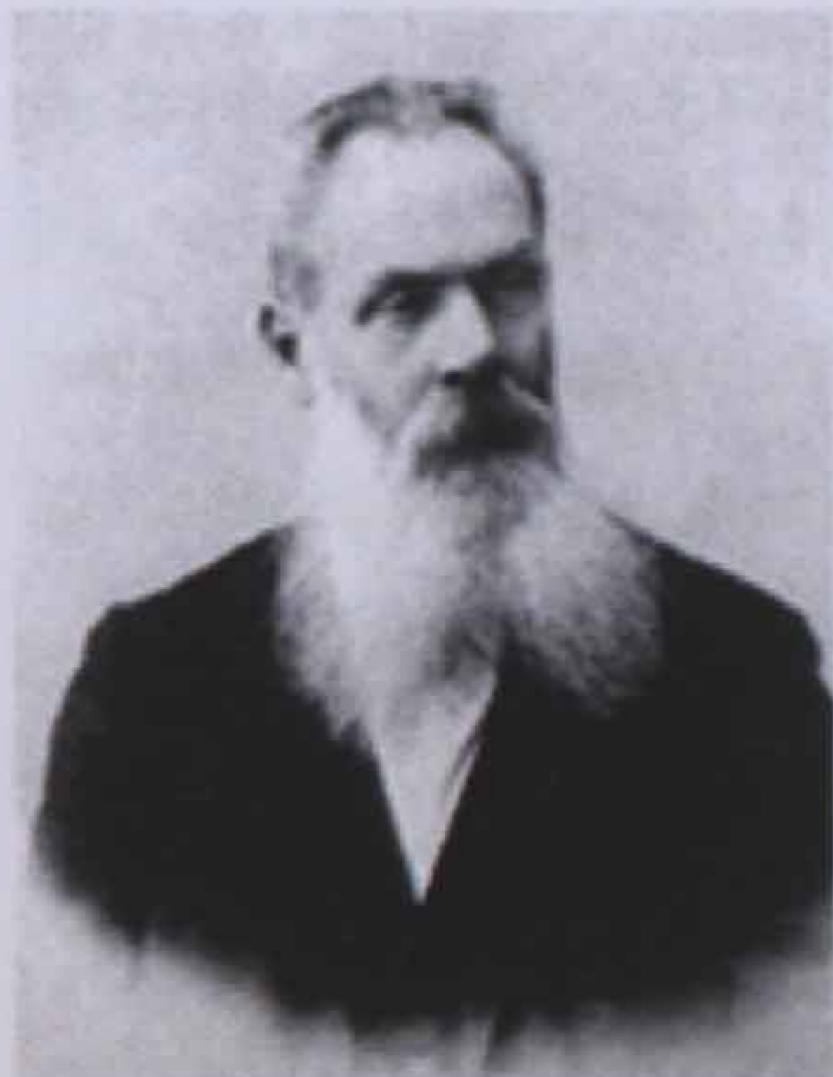
Адольф Фёдорович Маркс. 90-е годы.

Адольф Фёдорович Маркс родился в Германии, в 21 год переехал в Россию, в 31 год основал в Санкт-Петербурге издательство. Самым известным изданием Маркса стал первый в России массовый иллюстрированный еженедельный журнал «для семейного чтения» – «Нива» (в 1903 году один номер журнала стоил 25 копеек без доставки, 30 – с доставкой). В журнале публиковались очерки и статьи по географии, истории, медицине, «наукам и искусству», рассказы, романы, повести, стихи русских и зарубежных авторов, а также репродукции с картин выдающихся художников и фотографии о важнейших мировых событиях. С 1879 года стали выходить бесплатные приложения к «Ниве» – картины, портреты, календари и т. д., а с 1894