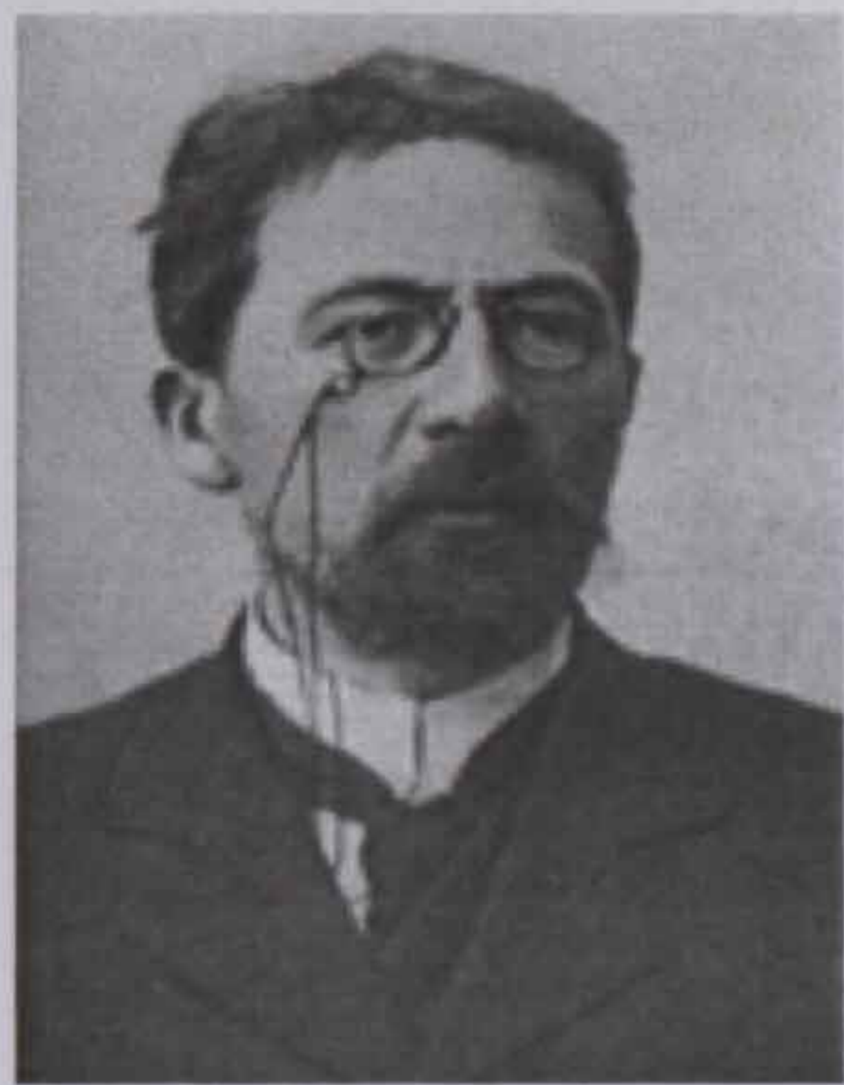
Антон Павлович Чехов.