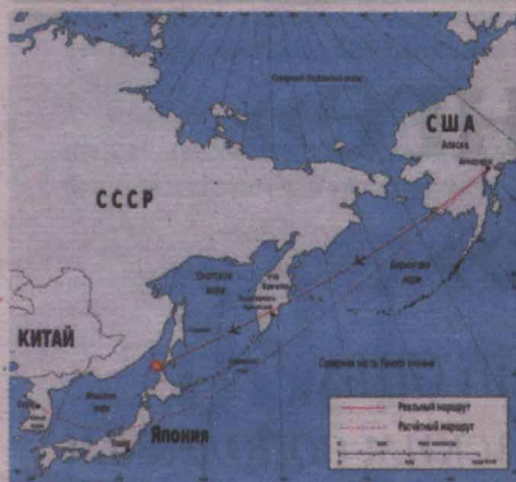
Особенно западные агентства возмущались тем, что самолет был сбит над нейтральными водами.

спросили: что там такого на дне находите? Они рассказывали, что находят множество вещей совершенно несопоставимых. Предметы туалета и бытовая мелочь, поднятые с глубины на свет божий, выглядели как-то неестественно, как нечто очень старое, буквально, как мусорный хлам. Чемоданы, набитые всякой дрянью, почему-то связанные