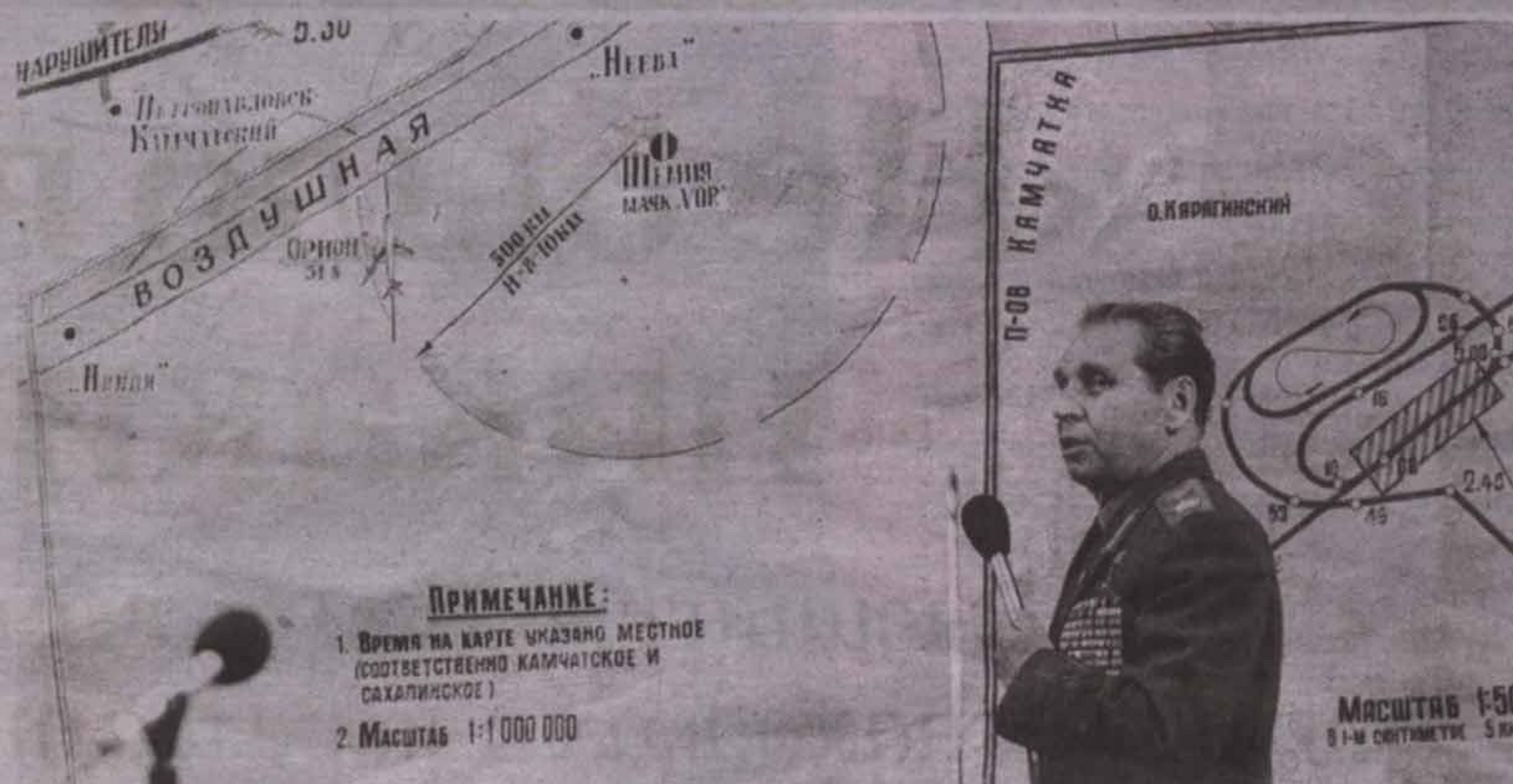
По официальным каналам об инциденте в СССР сообщили только через неделю.

Время поисковых работ совпало с сезоном осенне-зимних штормов. Почти всегда стояла плохая погода