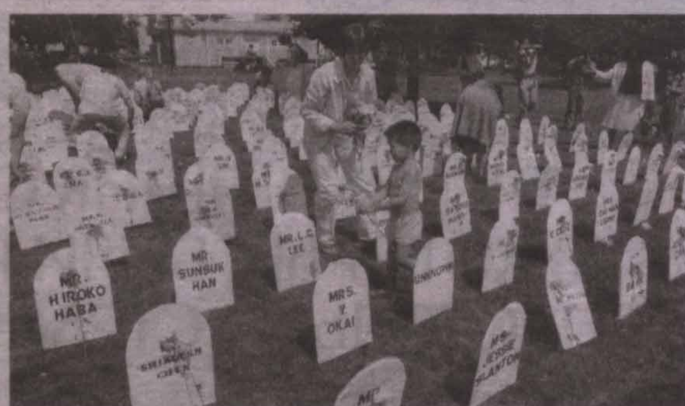
По миру прокатилась волна протестных выступлений против СССР. В Вашингтоне на акции памяти погибших пассажиров рейса KAL-007 поставили на площади картонные памятники.

— Для нас это тоже была загадка. По словам водолазов, на дне им не попались ни трупы людей, ни фрагменты тел. Да и кресел было обнаружено только тринадцать — по числу членов экипажа. Для всех, кто участвовал в поисковой операции, было понятно: никаких пассажиров не было, это была провокация, хорошо подготовленная разведывательная операция американских спецслужб вместе с южнокорейской разведкой. Я много лет следил за тем, как продвигается расследование этой авиакатастрофы. Самолетов было два. «Боинг-747» летел вдоль границы, чтобы выявить нашу систему ПВО. Параллельным курсом летел самолет-разведчик RC-135. Задача была такая: самолет идет специально над нашей территорией. У нас включаются радиолокаторы, в том числе и противозвуковой обороны. Эти радиолокаторы имеют определенные частоты, и они фиксируются американским самолетом-разведчиком. Так выявляется секретная информация для последующего прорыва нашего оборонного противозвукового щита. То есть уже для боевых действий. Таким вот образом эта радиоэлектронная разведка и проводилась. У Сахалина был сбит американский военный самолет, на борту которого находились только 12 человек экипажа и представитель разведки. А южнокорейский «Боинг» с пассажирами потерпел катастрофу через 40 минут при загадочных обстоятельствах