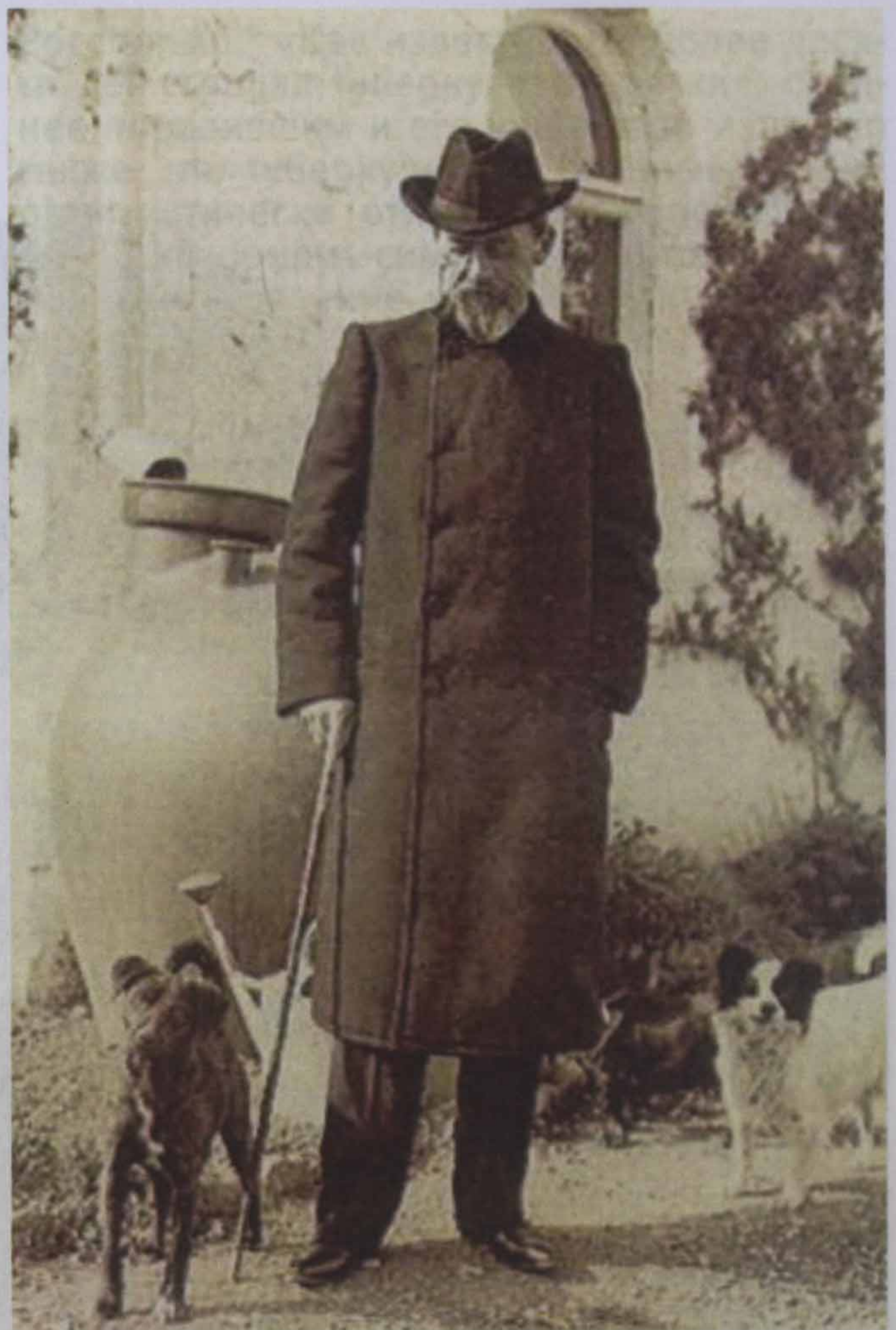
А.П. Чехов в 1901 г.

Несмотря на рано обнаружившийся талант писателя, он оставался прилежным