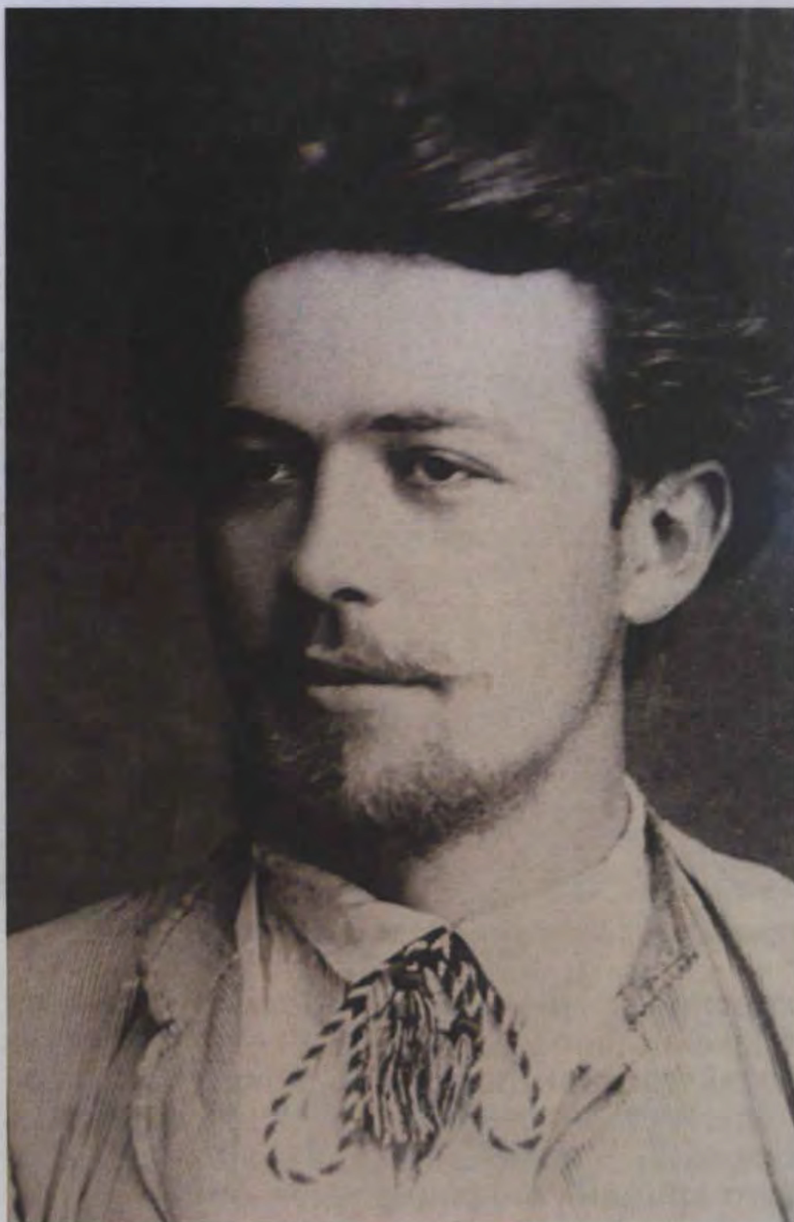
А.П. Чехов в 1888 г.

ске Чехов прибыл в Сретенск. Здесь он сел на пароход «Ермак» и поплыл по Шилке, затем по Амуру. Тепло, комфортно, кормят по расписанию, Верхний Амур невероятно красив. «Я в Амур влюблен! Был бы миллионером, имел бы на Амуре пароход! Вот бы где дачу нанять!» – пишет Чехов родным.