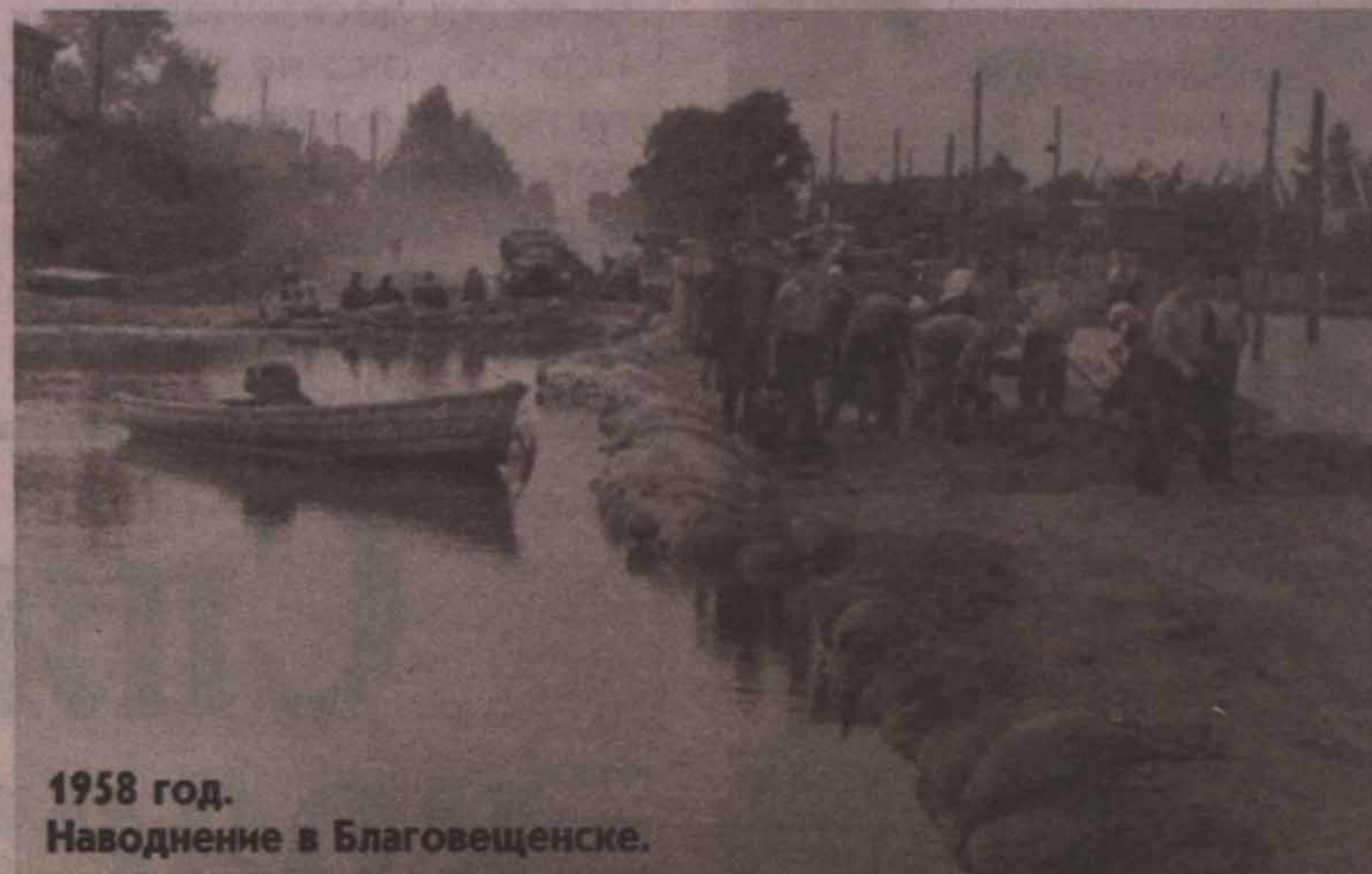
1958 год. Наводнение в Благовещенске.