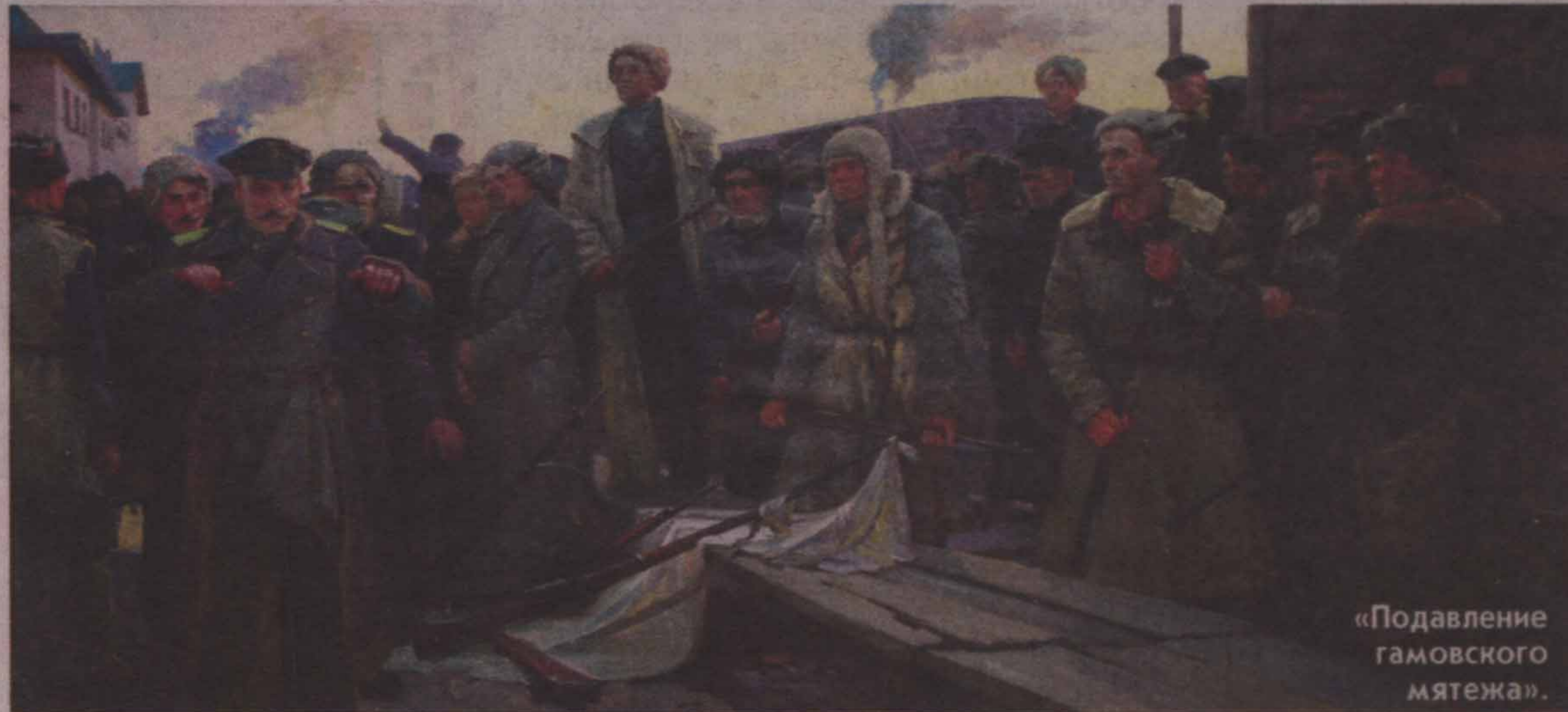
«Поддавление гамовского мятежа».

Место в садике младшему Коркину выделили (старшего там все время нагружали просьбами то оформить стенгазету, то плакат нарисовать,