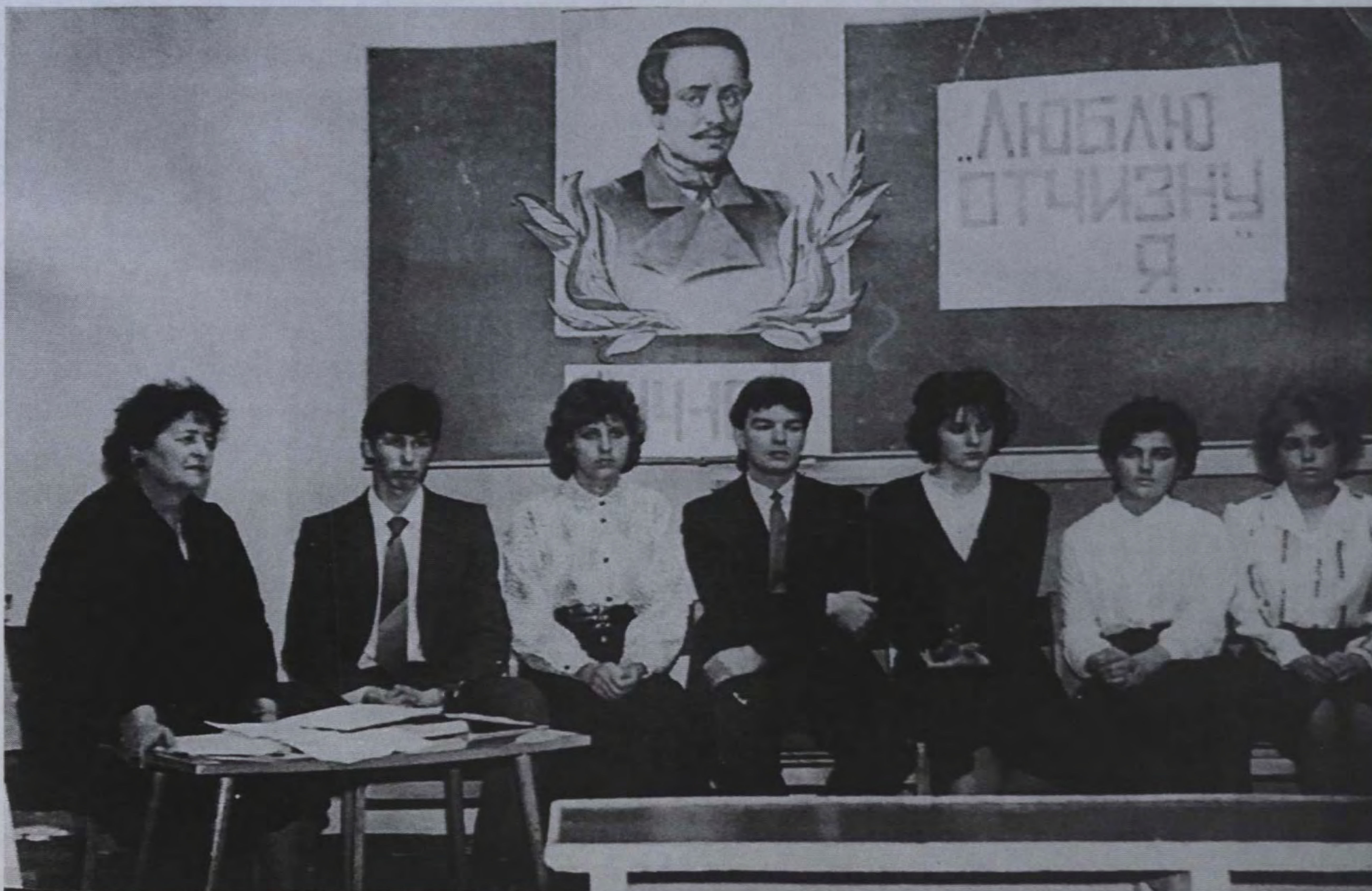
Тот самый вечер Лермонтова. Мы с нашей вдохновительницей. 1990 г.