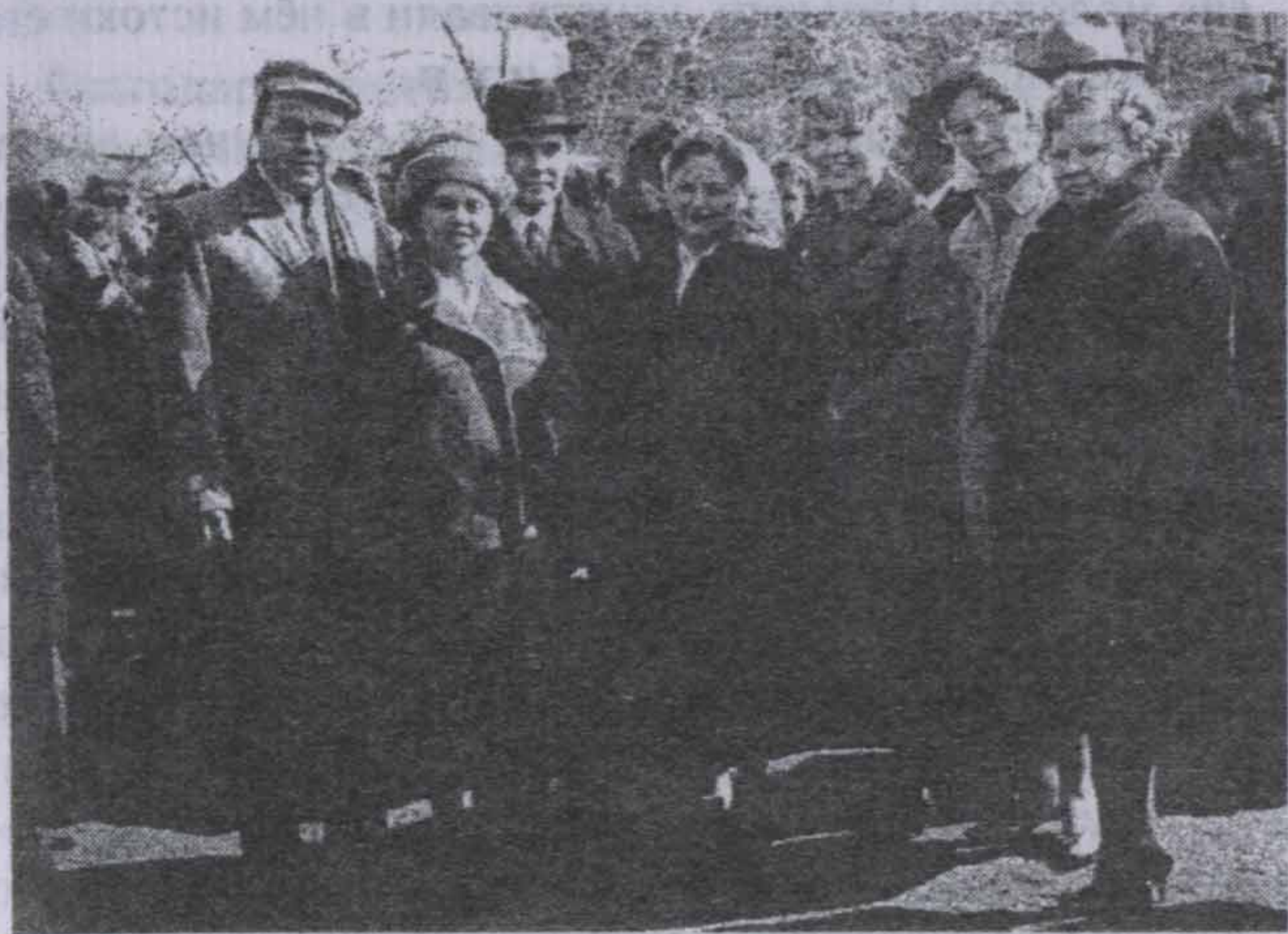
Вот и настал праздник Первомай