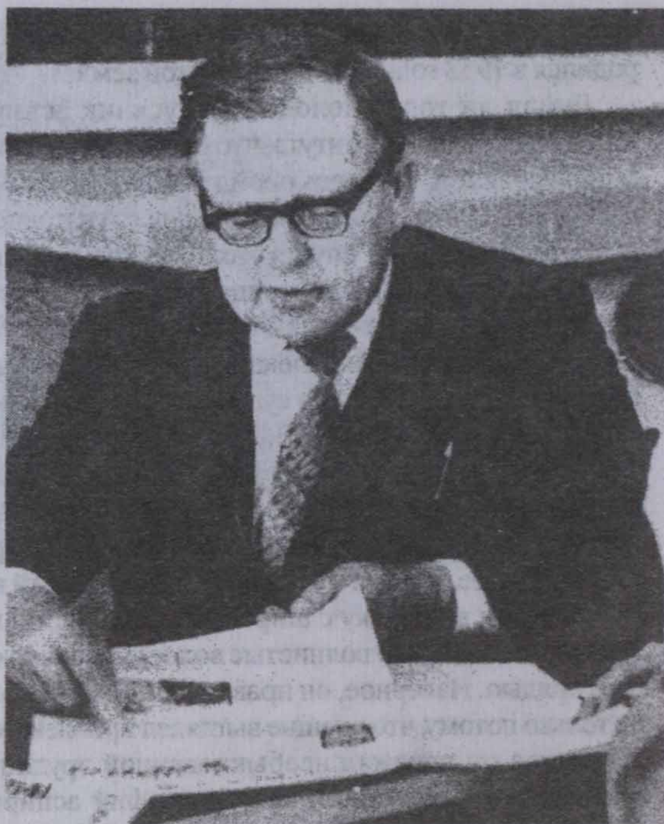
В научном поиске