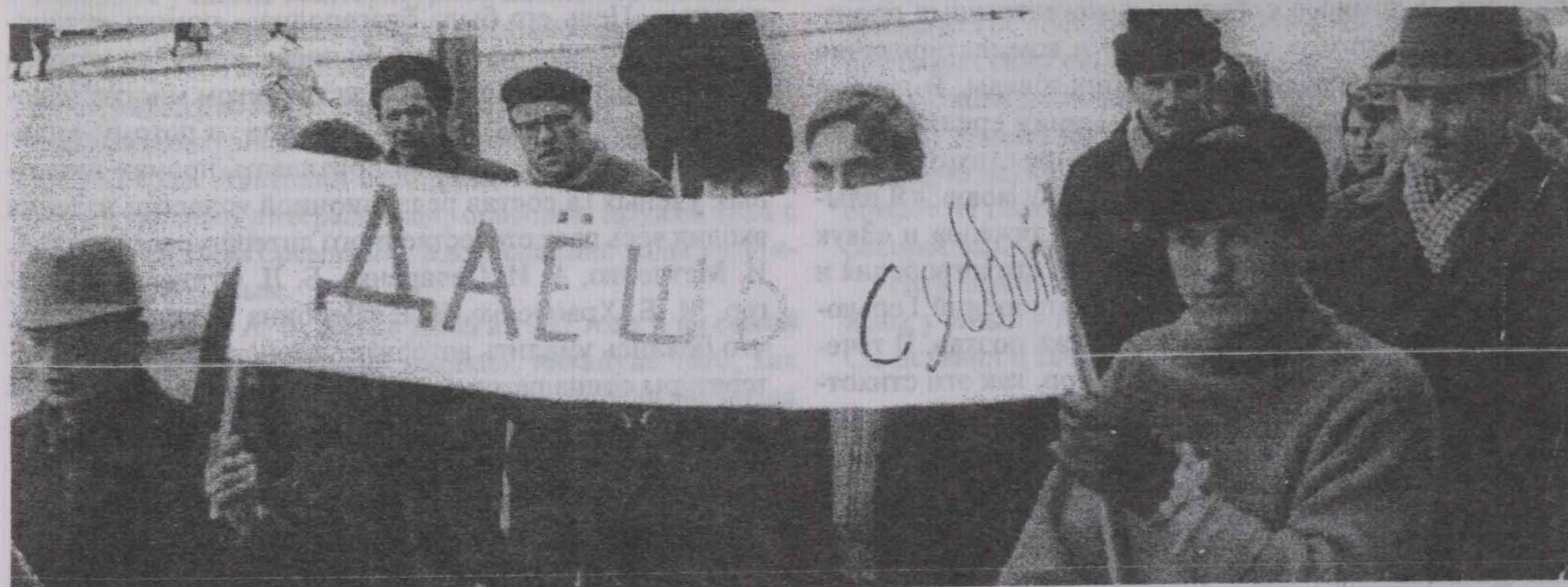
На субботник ходили всем миром