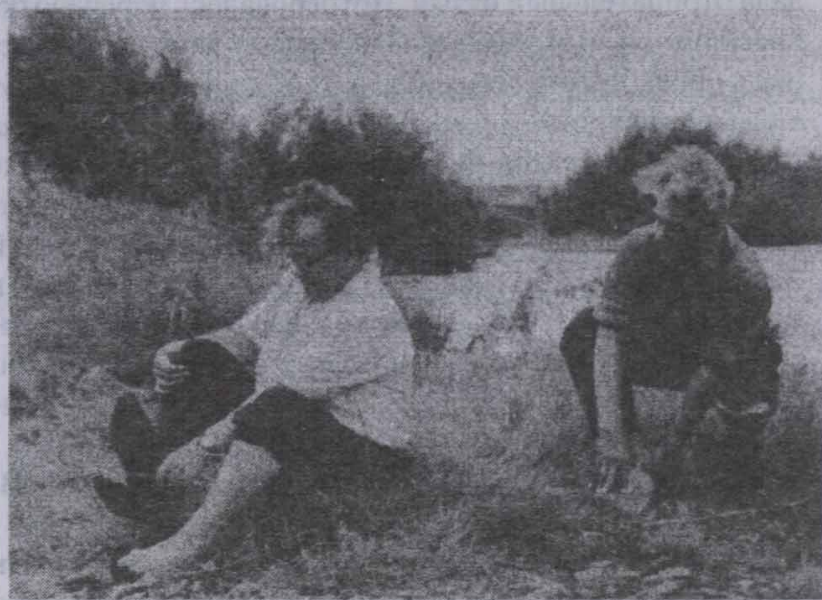
Рыбалка требует снаровки