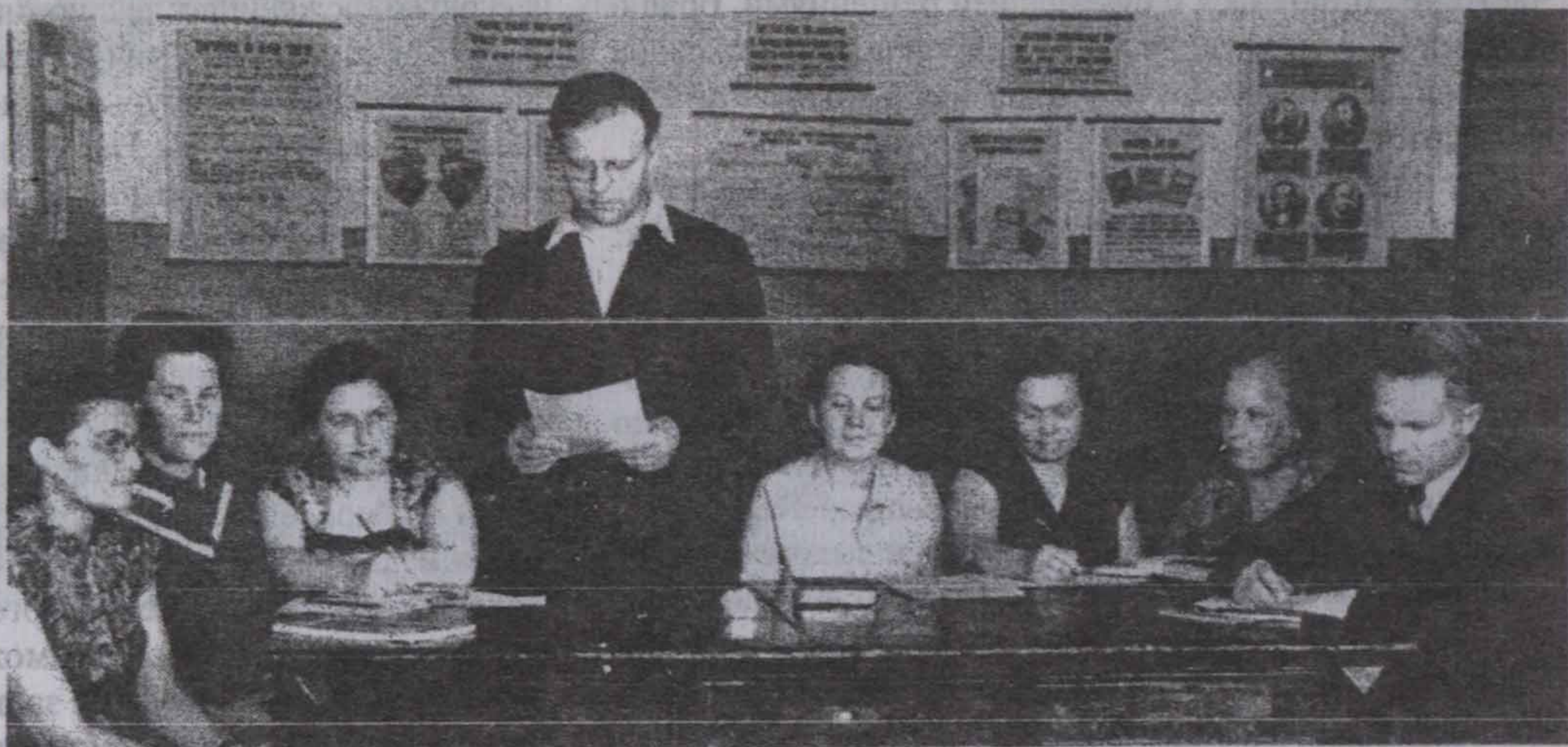
Вести заседание кафедры - ответственная работа.