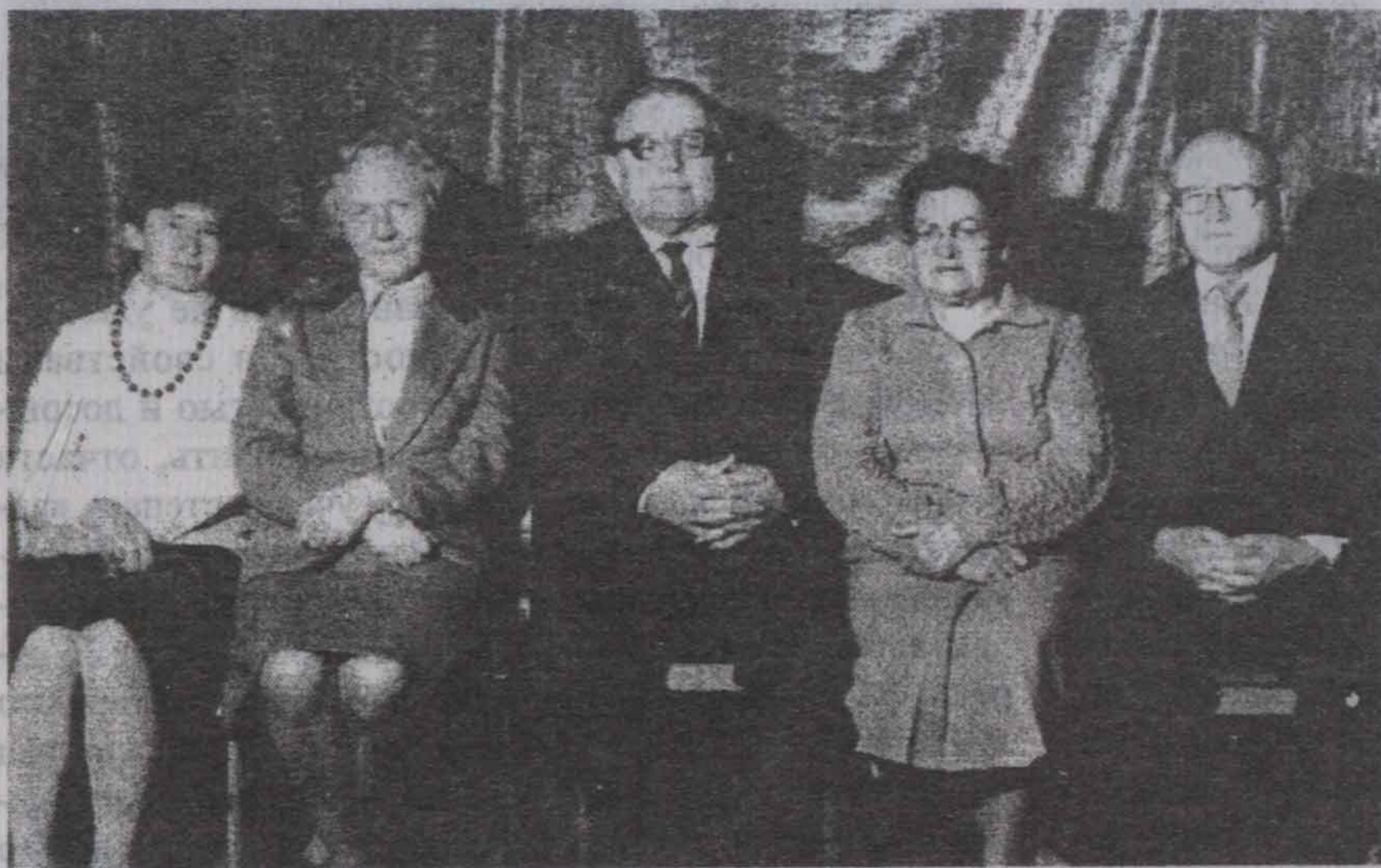
Плечом к плечу: многие годы их трудами создавалась газета «За педагогические кадры»