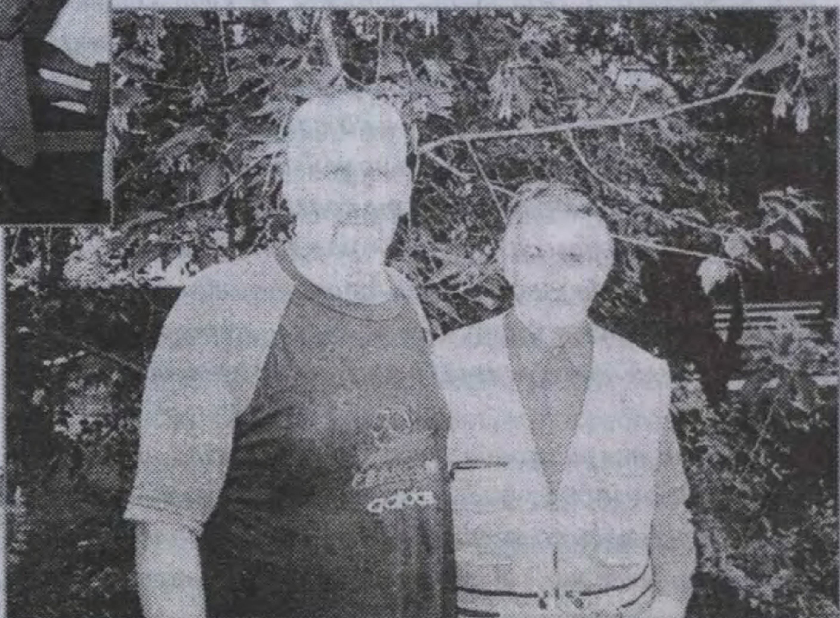
90-е годы. Белогорск