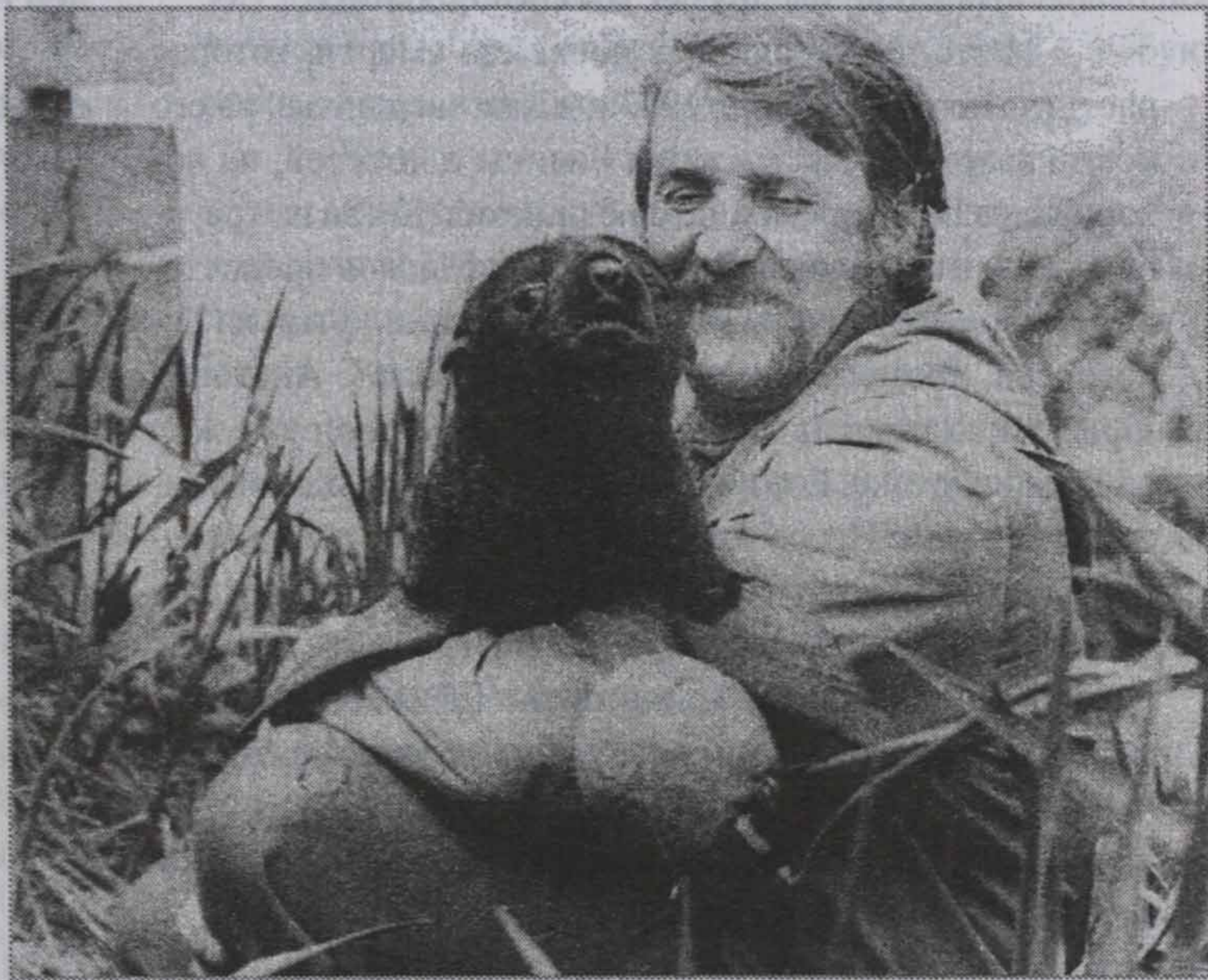
С котиком на острове в Охотском море