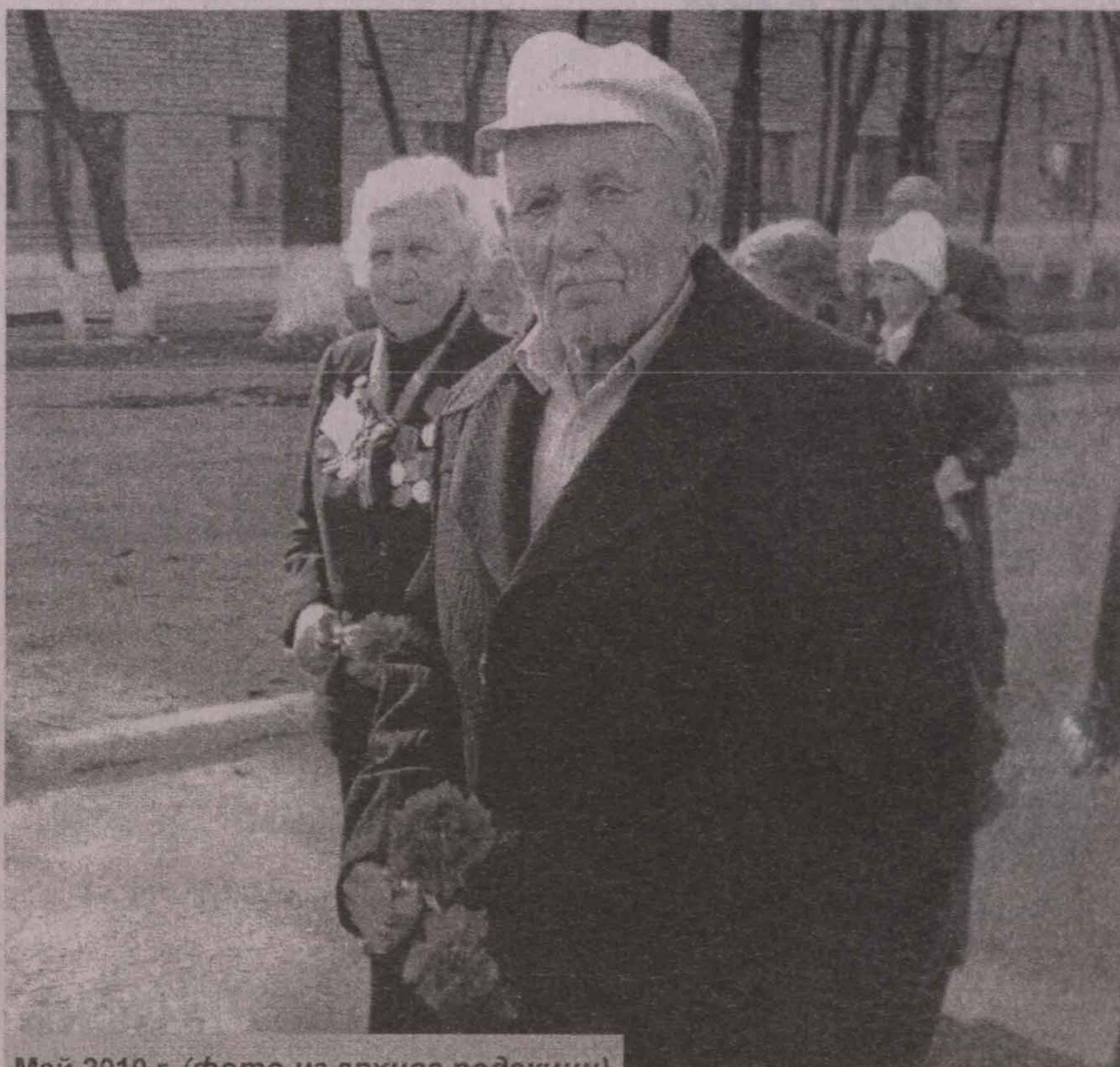
Май 2010 г.