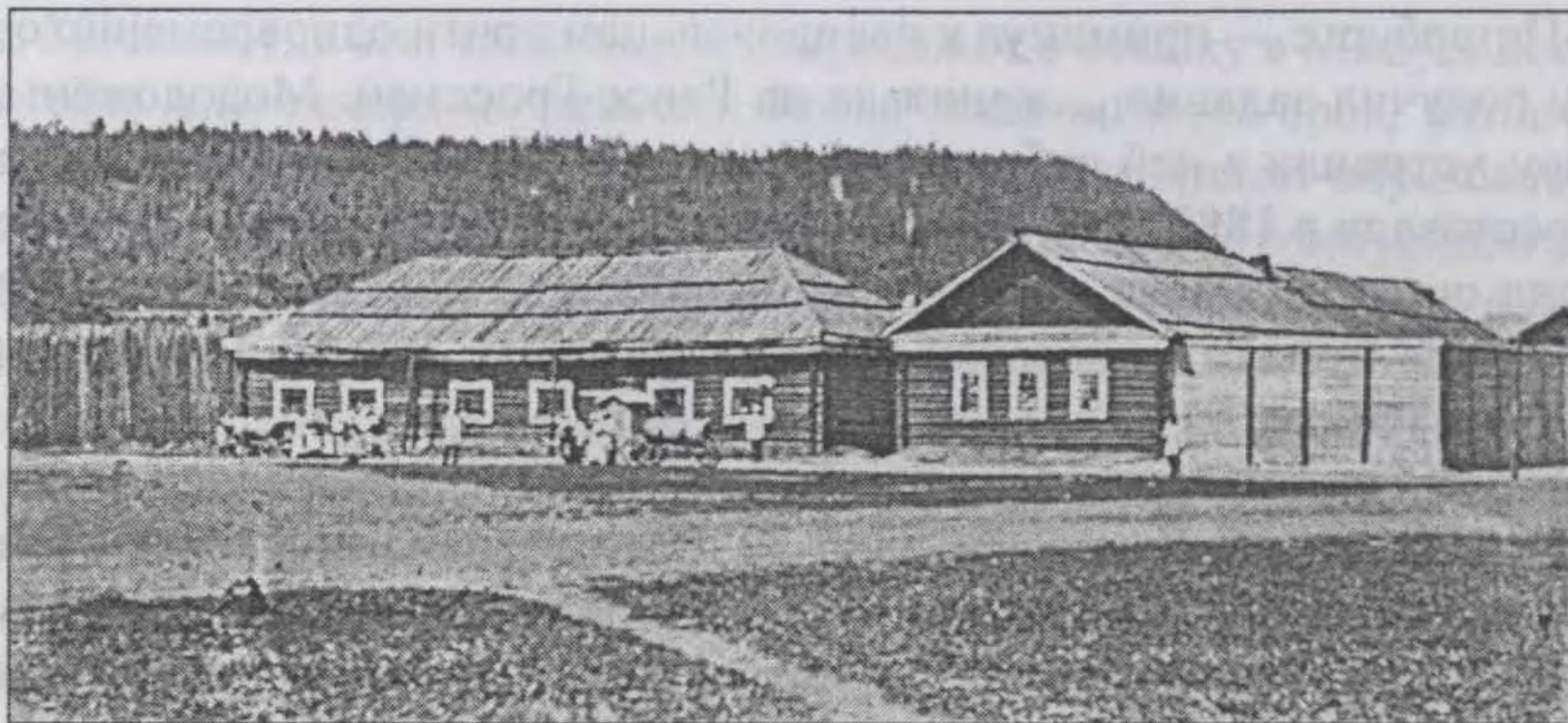
Ссыльно-каторжная тюрьма на Усть-Каре.

Эти несколько писем Михайлова сыграли в судьбе Анны трагическую роль. После её ареста их нашли при обыске в Петропавловской крепости 14 июля 1882 года «защитыми в платье», приобщили к следствию, и они стали главным доказательством её связи с исполкомом «Народной воли» (остальные улики были не так существенны). Убийство Александра II стало началом конца организации «Народная воля». Один за другим прошли аресты её членов. По «процессу семнадцати» Анну Корба в апреле 1883 года приговорили к двадцати годам «каторжных работ на заводах». Александр Михайлов умер от отёка лёгких в заключении в марте 1884 года.