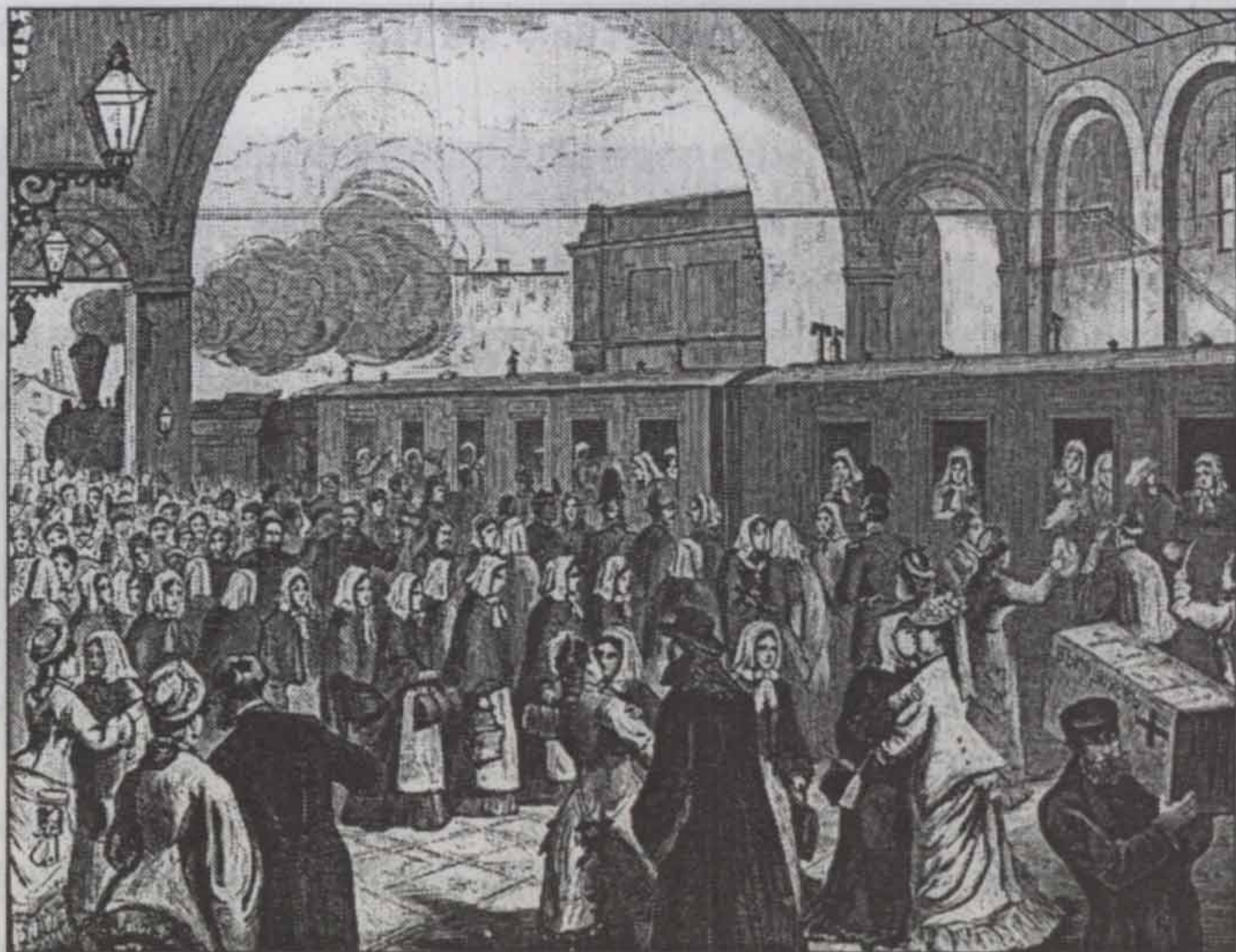
1877 год. Отправление первого санитарного поезда на фронт Русско-турецкой войны.

одному человеку», — написала она в упомянутой автобиографии. Казнь одного из террористов в 1878 году явилась, по словам Анны, «последней ступенькой, приведшей меня к революционному пути».