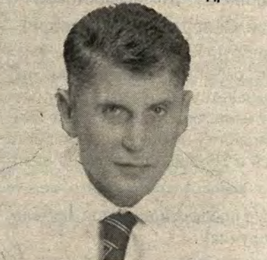
Кожемяко Олег Николаевич

июле 2007 г. включен в состав консультативной комиссии Государственного совета РФ. 2007-2008 гг. – помощник руководителя Администрации Президента РФ. Действительный государственный советник РФ 3 класса. Кандидат экономических наук.