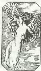
ДУША С НЕБЕС НЕ ВОЗВРАТИТСЯ...

всё соединить; Абсурд Хаосович, не признающий логики; Шакал, продающий в своём магазине мировоззрения жизни и смерти и пр. Эзотерическое начало повести – в воссоздании идеи очевидного несовершенства явленного мира. Нельзя, однако, не заметить, что абстрактно-эзотерические рассуждения подавляют художественное начало в произведениях Ф.