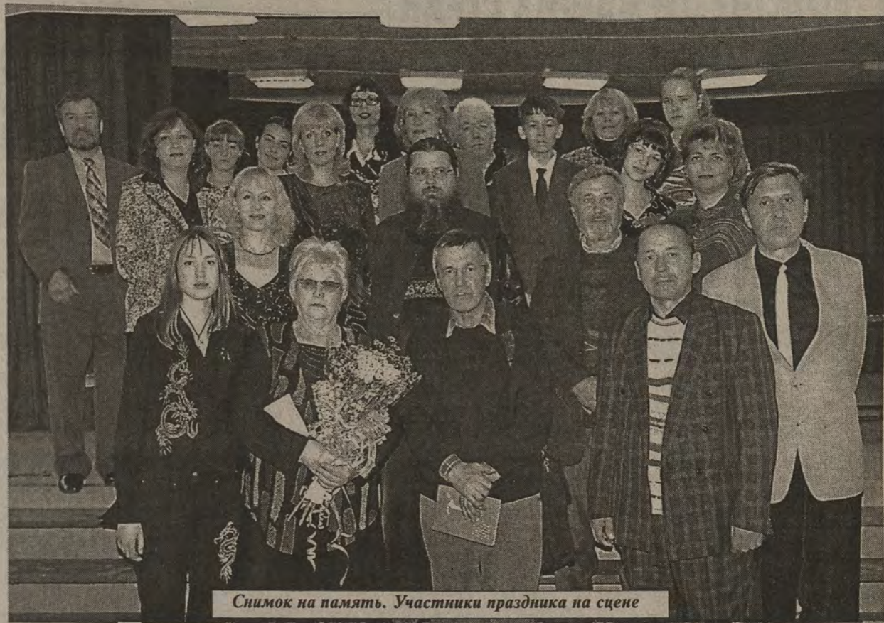
Снимок на память. Участники праздника на сцене

К сожалению, время встречи было ограничено, гостей ждал заказанный автобус. Иначе общение со свободненцами продолжалось бы ещё долго. Праздник вообще замыслился более представительным и насыщенным, но многие его участники не смогли приехать по разным причинам, в том числе и личным. А детский казачий хор, который должен был завершать концерт песней «Встань за веру, Русская земля!», в этот день принимал участие в празднике Покрова в Благовещенске. Но совпадение Дней духовной поэзии с