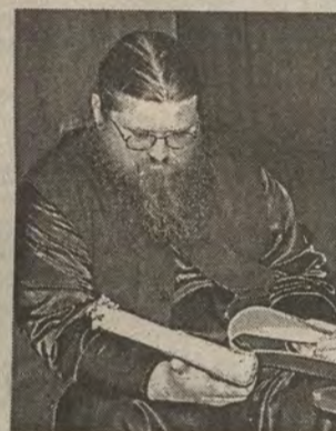
«Русский паломник» стал ценным подарком