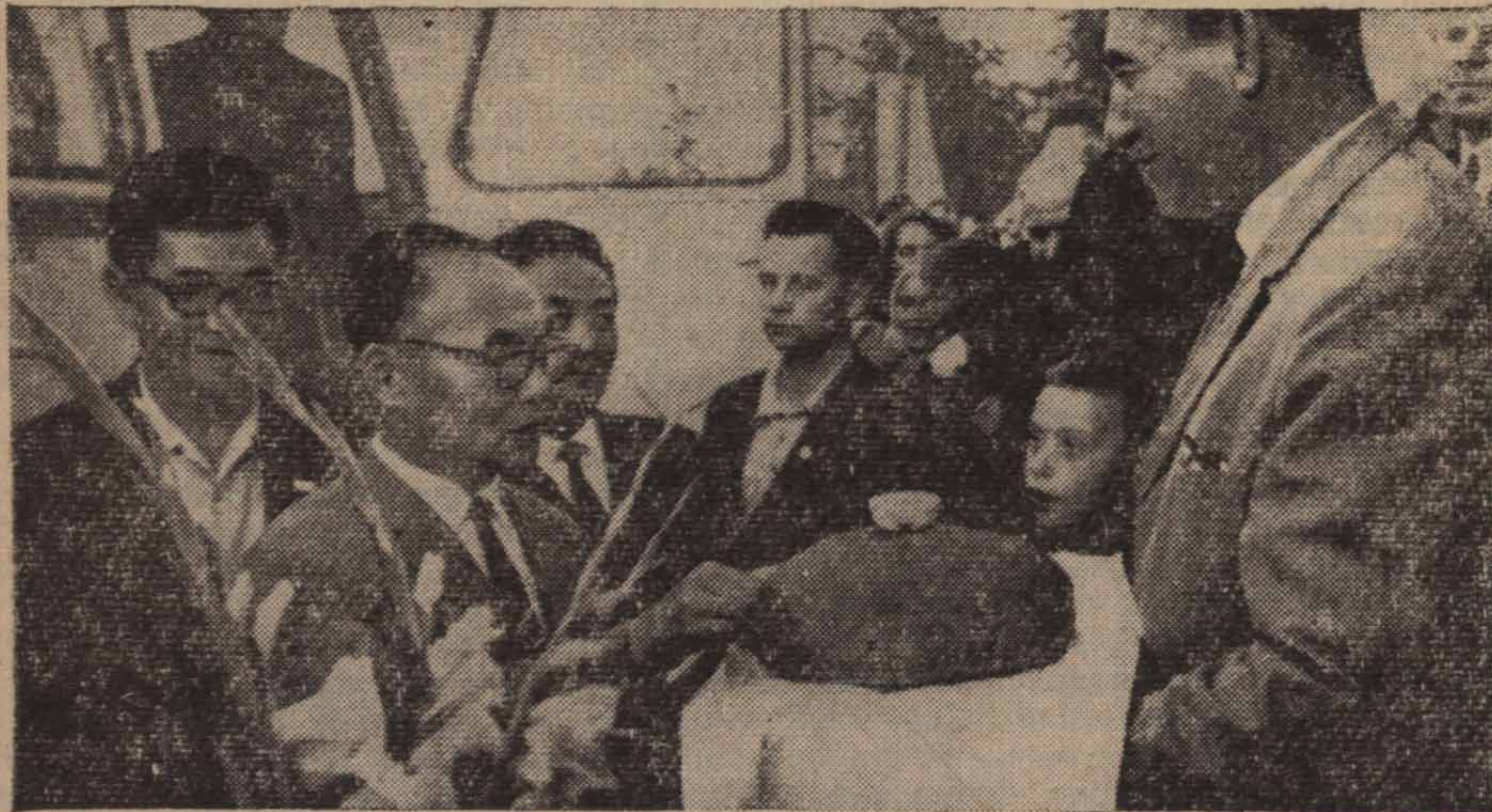
Встреча с хлебом-солью в поселке Хор

Ну, а что же умеют делать эти «взрослые» люди? Ни душевной зрелости, ни жизненного опыта у них, конечно, еще нет. И начинаются конфликты с жизнью. И это естественно. Коль созрел человек физически и, как говорится, выиграла в нем силушка молодецкая, то нужен ей и объект, достойный применения. Но что порой наблюдается? Летом по городам и весям да по местам боевой и трудовой славы отцов маршируют с шумом и грохотом «мальчишки и девчонки» этак под два метра ростом... А их не такие уж