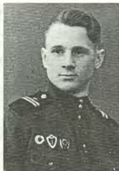
Воин Советской армии.