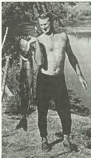
Ай да таймень!

Душой семьи является бабушка, именно её справедливые упреки больше всего опасается Шурка, уйдя из дома без разрешения. Даже дед, глава семьи, заметив ложь внука, опасно оглядывается на бабу, хлопочущую у печки. Цен-