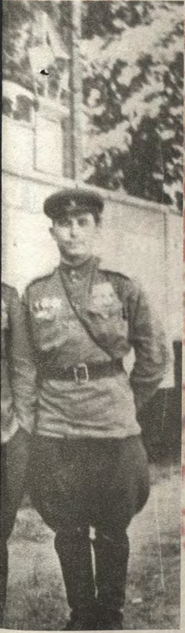
менко (слева). Германия, 1945 г.