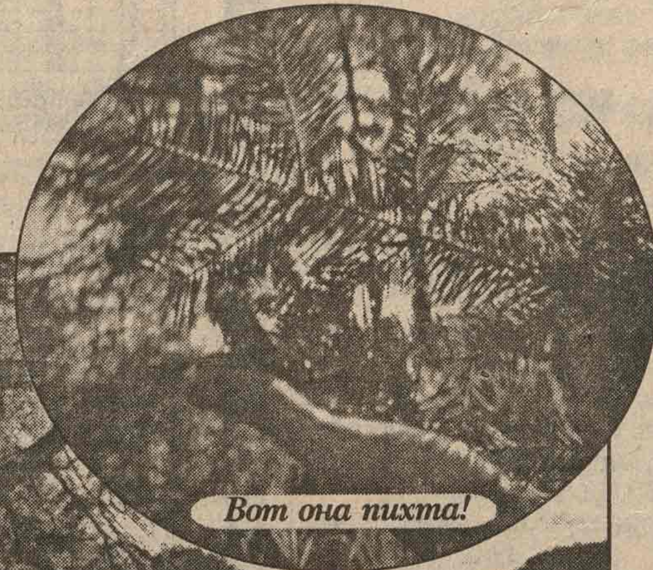
Вот она пихта!