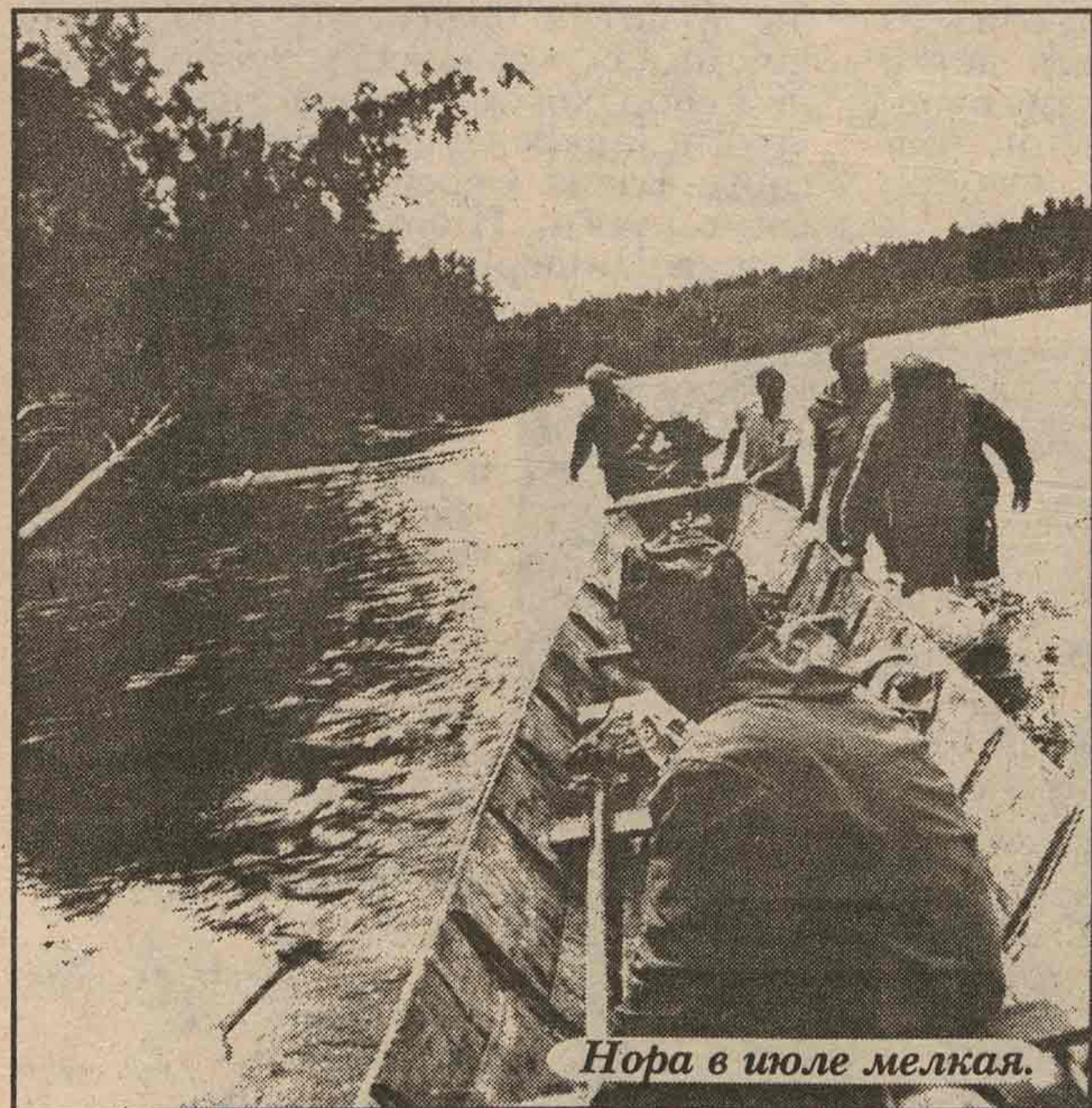
Нора в шоле мелкая.