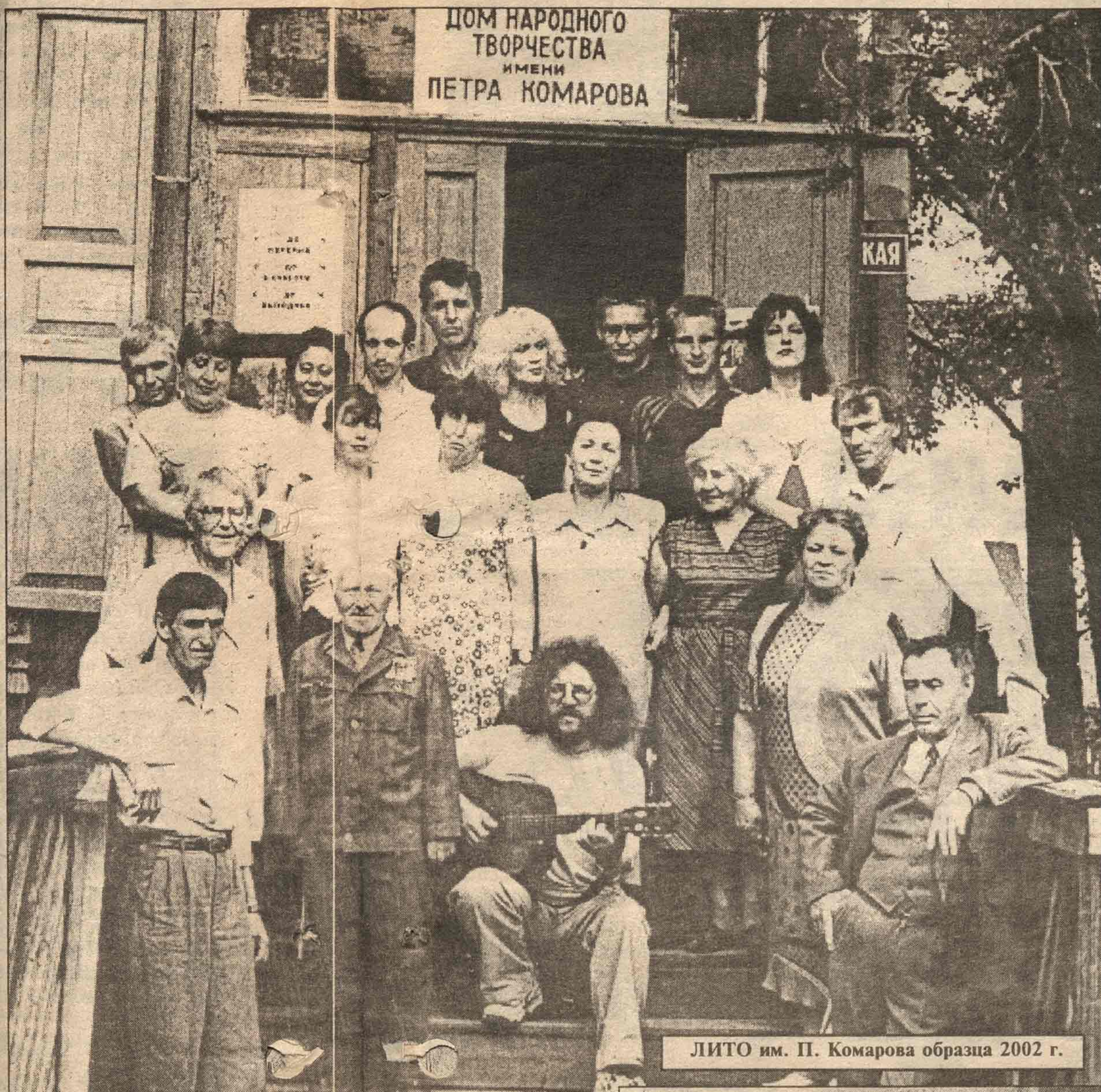
ЛИТО им. П. Комарова образца 2002 г.

Свободном для всех, кто причастен к литературе, сам пишет и читает других, состоится своеобразный праздник. К этому объединению (ЛИТО) этого города исполняется 50 лет