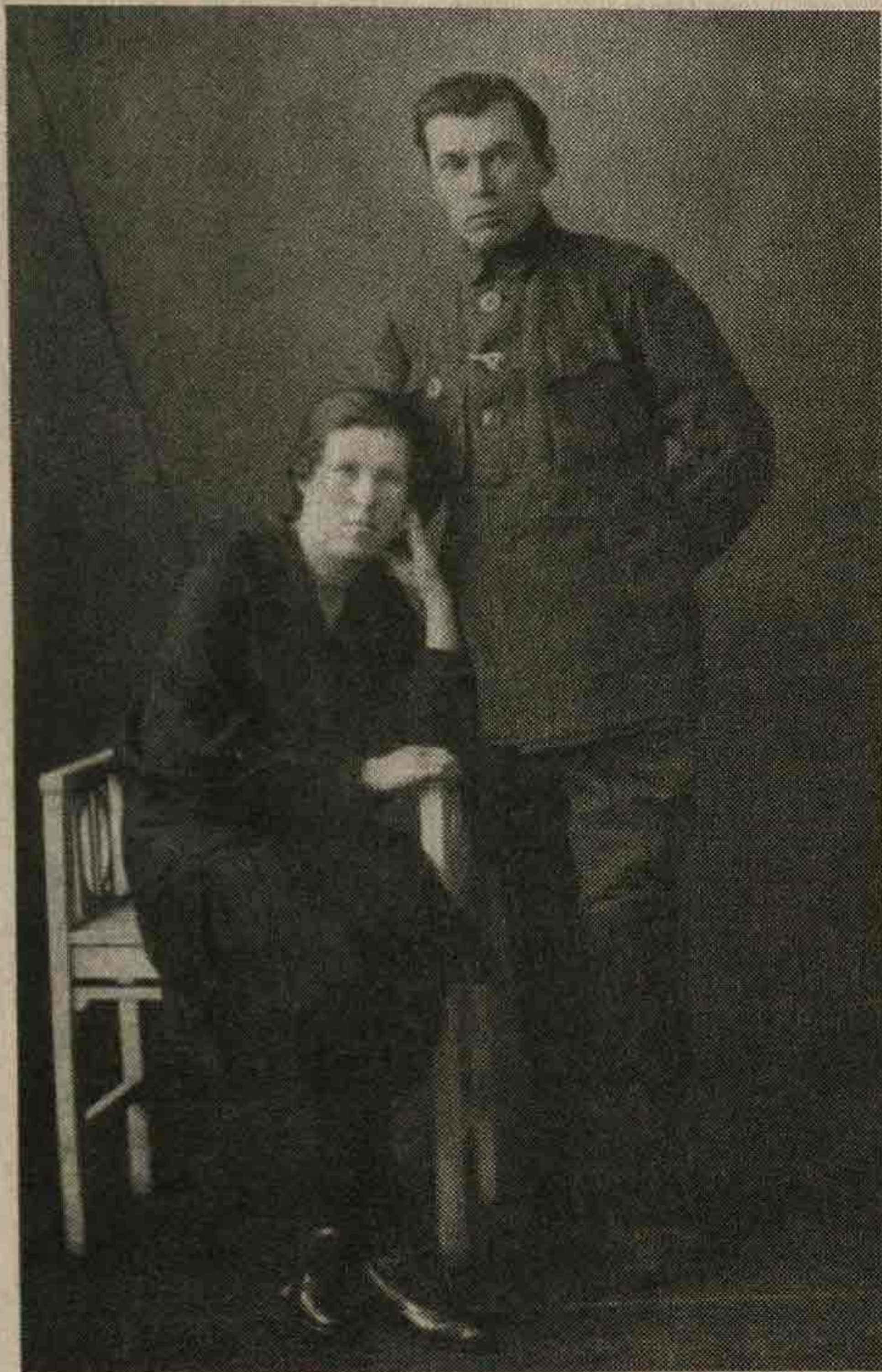
Город Щегловск под Кемерово. Родители на поселении умудрились сфотографироваться

пропали. Могло ли так быть: за десятилетие, до самой войны с германцем, не добралось до станицы единой весточки — ни письменной, ни устной? Потом война заслонила беду 1931 года. Лишь после войны узнали: баржу с арестованными станичниками затопили живьем в низовьях Амура.