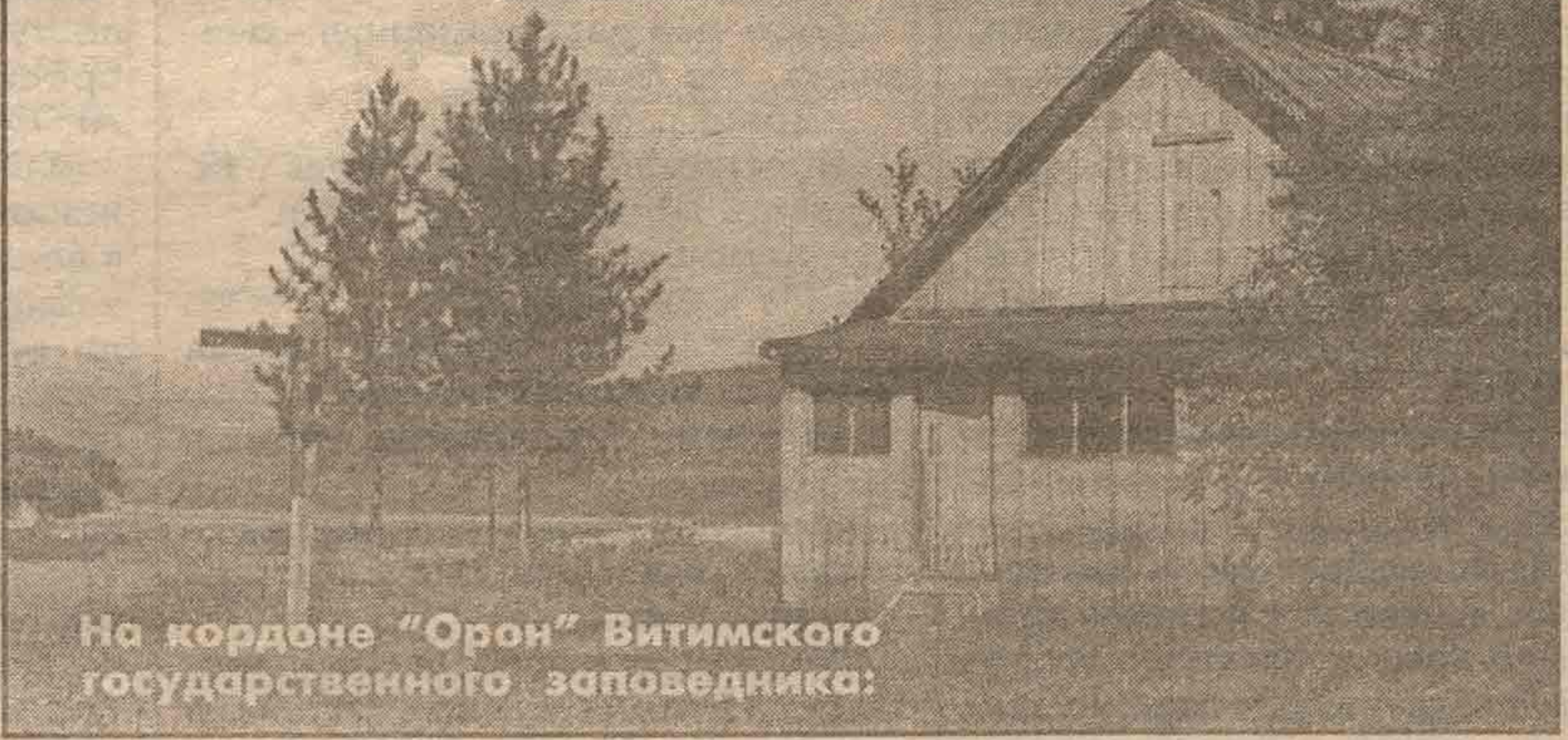
На кордоне "Орон" Витимского государственного заповедника: