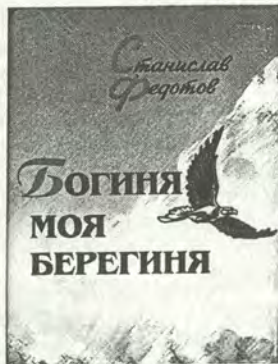
Поэтический двухтомник в миниатюрном исполнении, изданный в Благовещенске в 1998 к 60-летию поэта.

Первый том трёхтомника «Возвращение Амура» повествует о назначении Николаем I генерал-губернатором Вост. Сибири 38-летнего генерала Муравьёва. Последний, помимо деятельности по выявлению чиновничьих нарушений, борьбы со взяточничеством и пьянством, замыслил вернуть Российской империи левый берег Амура. Есть в романе и любовная линия: во всех начинаниях Николая Николаевича поддерживает француженка Катрин, ставшая в России Екатериной Николаевной.