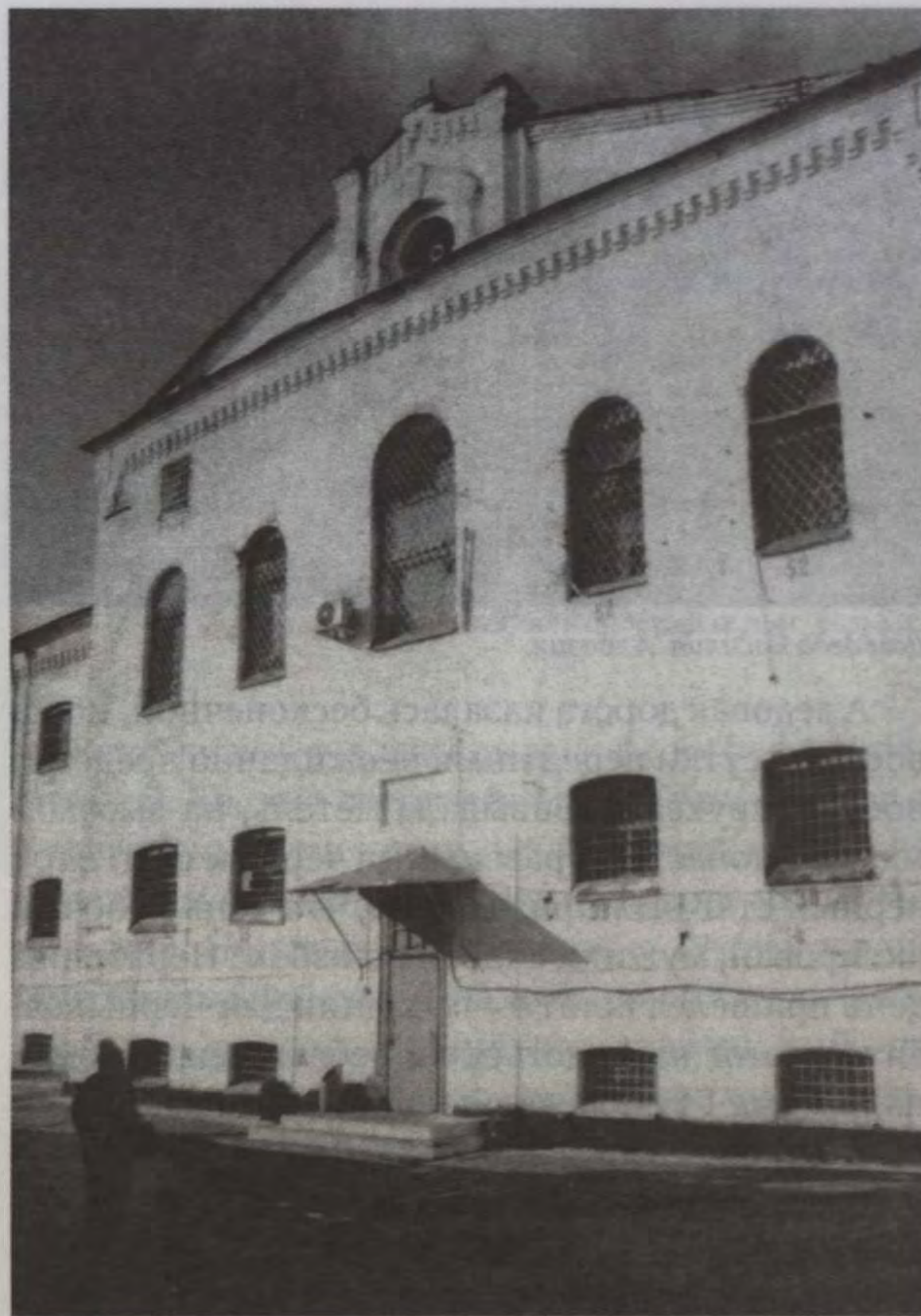
Корпус старой Благовещенской тюрьмы.

Хорошо, мама Гутя с детских лет знала гоньбу и, повязав шалью лицо, гнала за мужиками, не отставала. На случайных полустанках сердобольные сибиряки давали привал на ночь, пои-