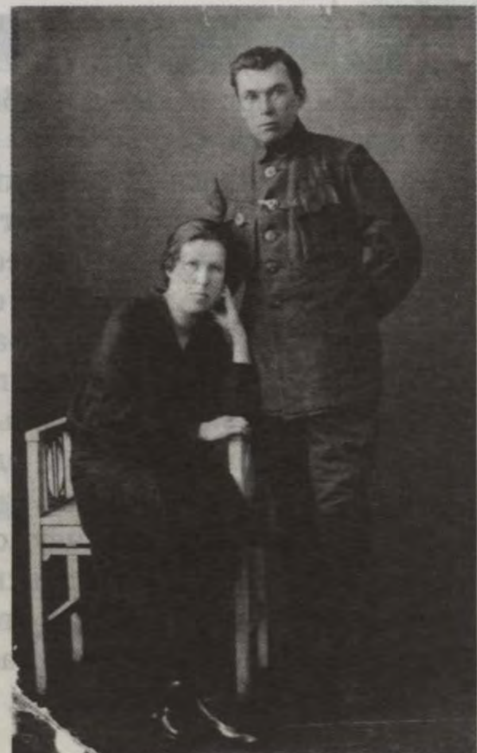
Тятя и мама Гутя в г. Щегловске (сразу после ссылки в Туруханск), 1932 год.

виданное испытание. Не просто выдержала. Испытание приподняло её над грешной землёй.