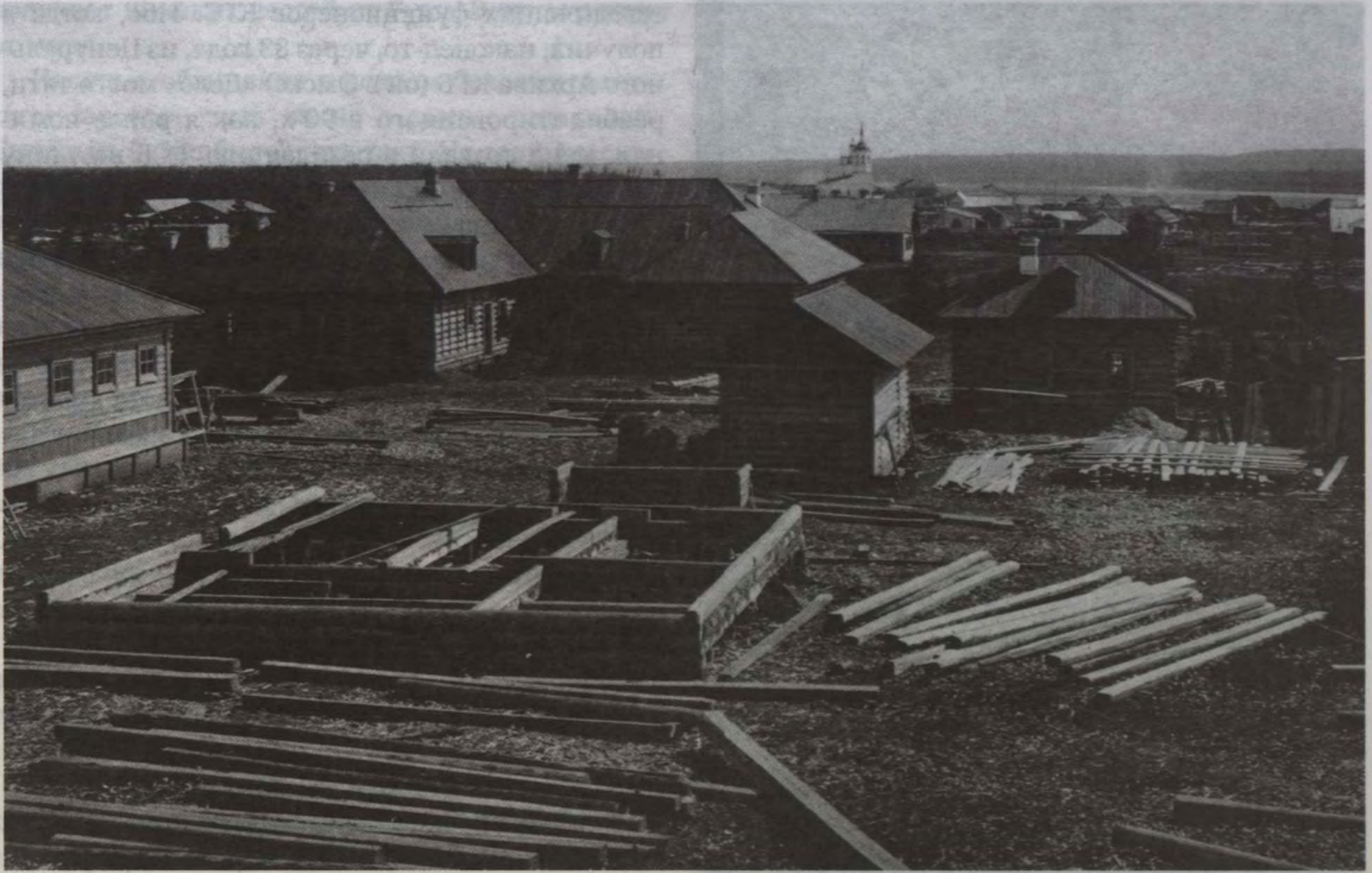
Туруханск строится. Благодный снимок, но не обольщайтесь, это 1912 год.