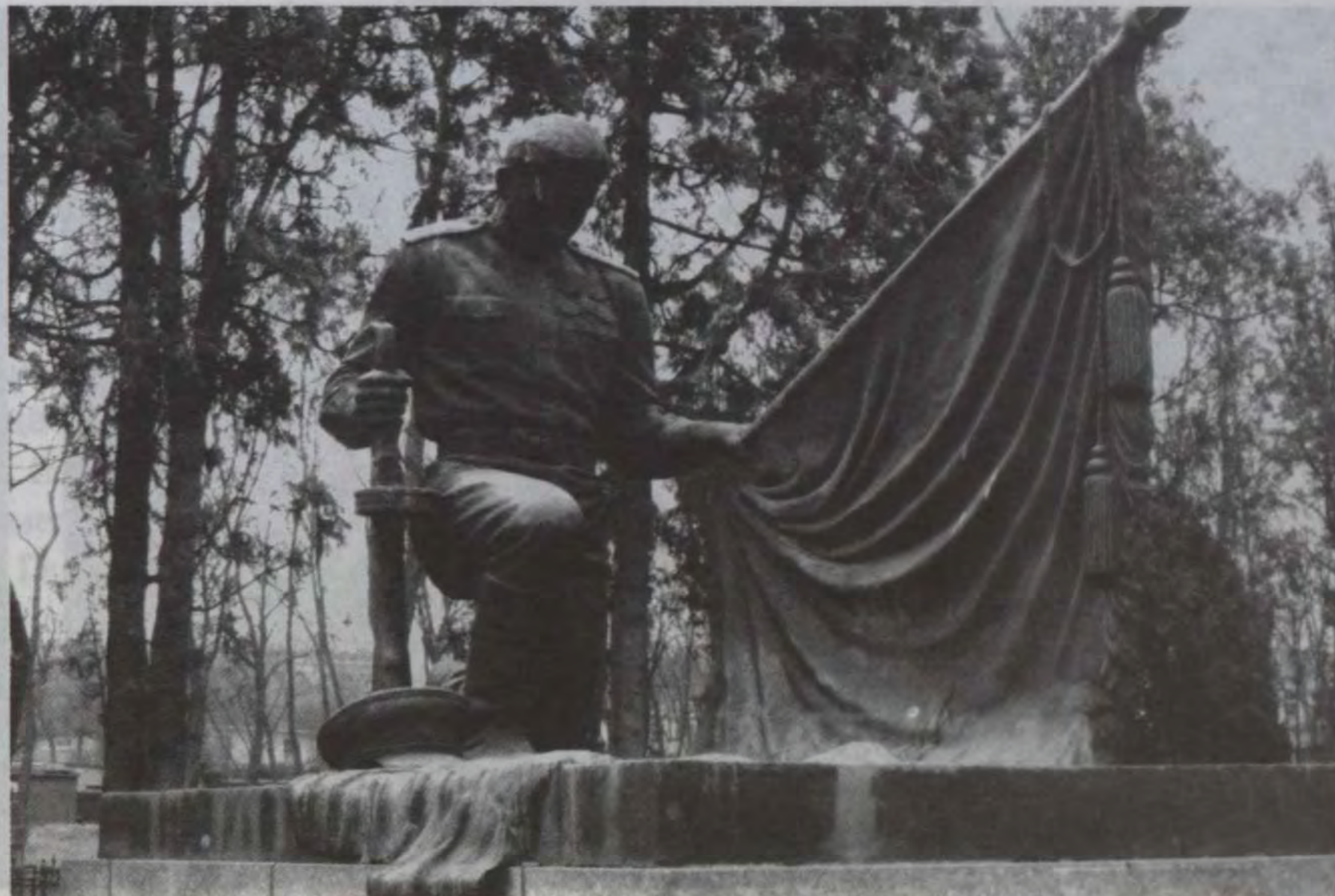
Русское кладбище в Порт-Артуре.

много обещал, но ранняя смерть тяти и война оборвали надежды.