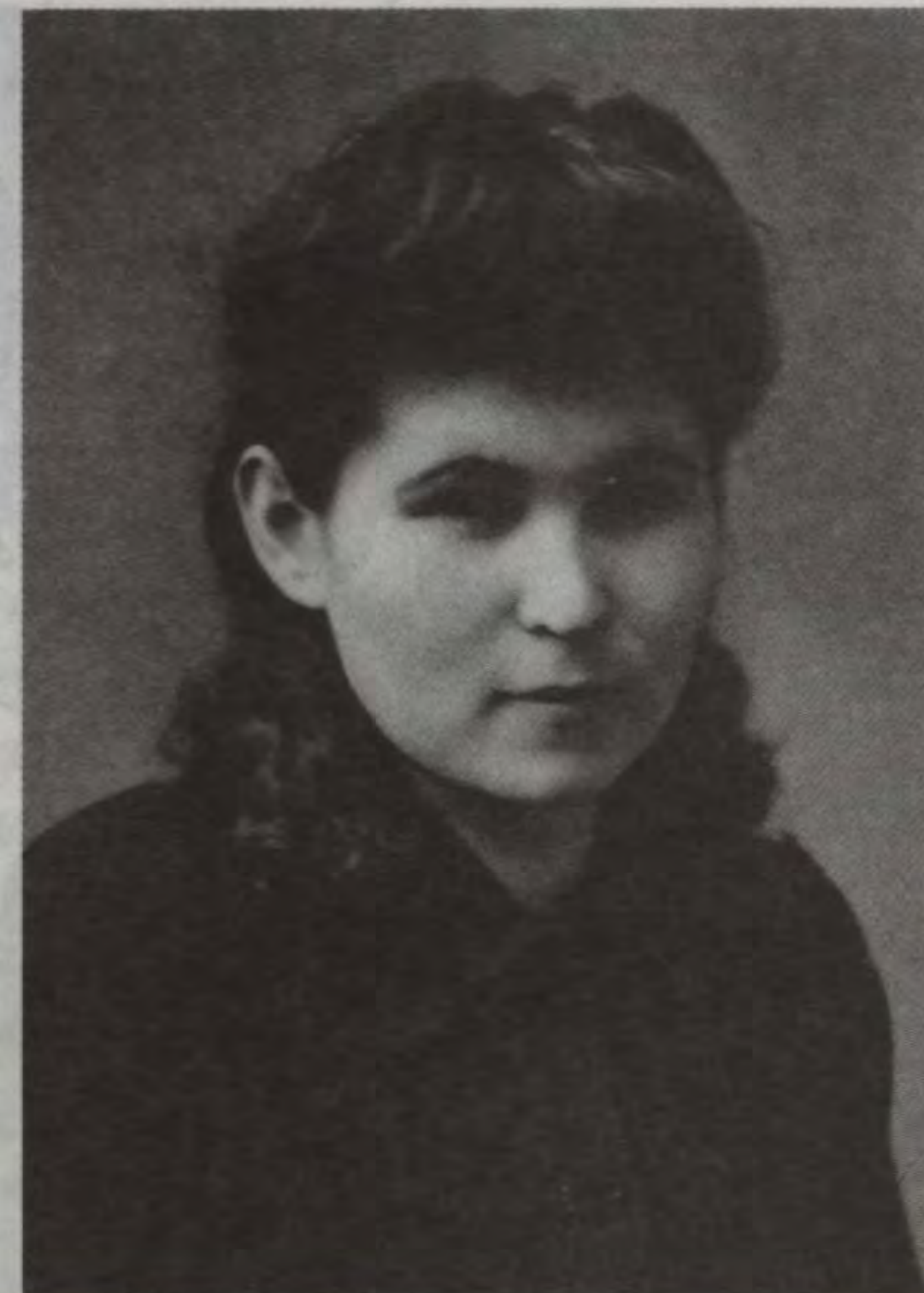
Сестра Гера. 1950 г.

пулемёта – ножная машина «Зингер» напоминал пулемёт.