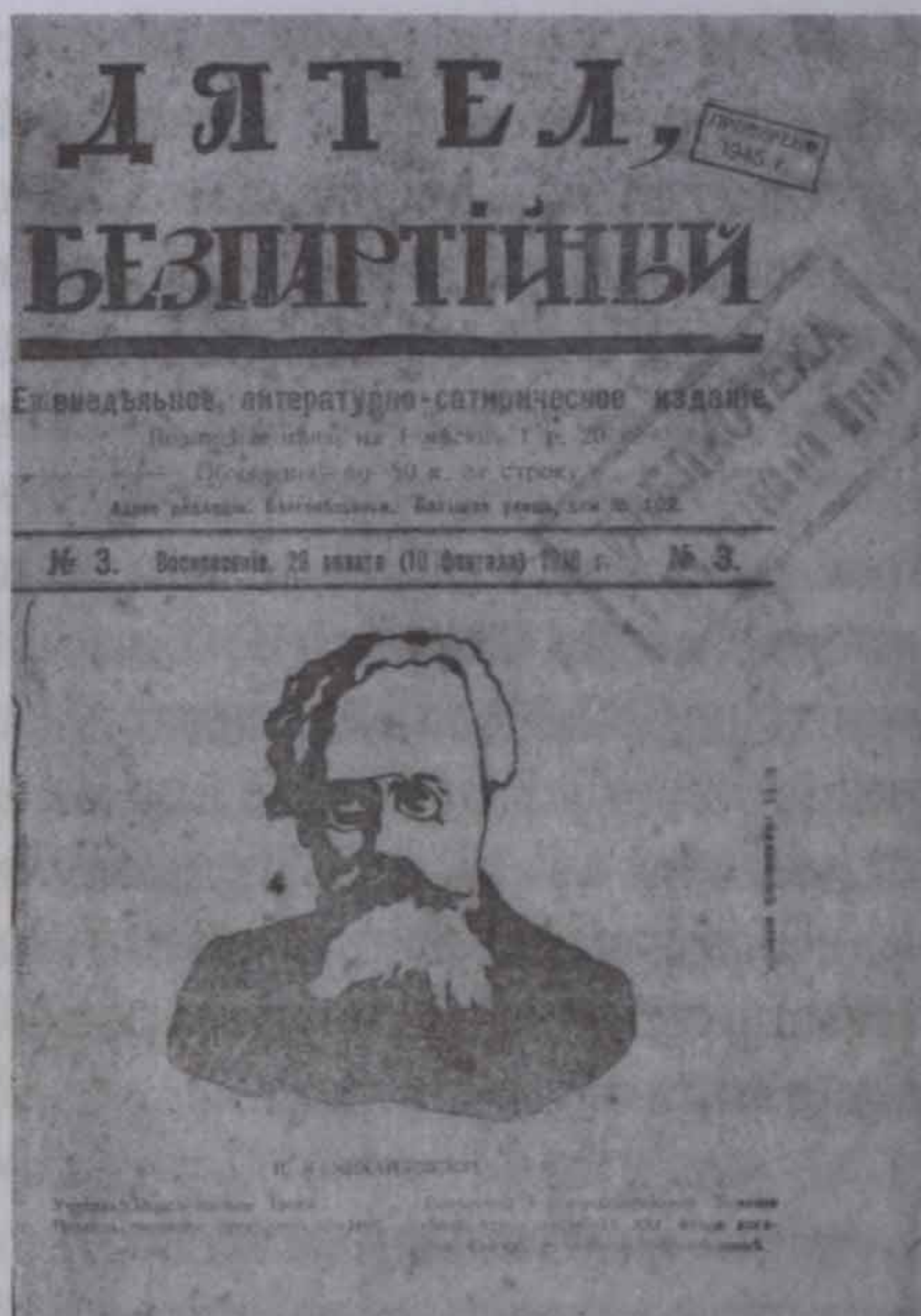
Обложка журнала «Дятел, беспартийный».

Русский философ первой половины XX в. Николай Бердяев в работе «О самоубийстве» писал: «Самоубийство совершается в особую, исключительную минуту жизни, когда черные волны заливают душу и теряется всякий луч надежды... Если бы самоубийца в роковую минуту способен был думать о других и совершить для других жертву, рука бы его дрогнула и жизнь его была бы